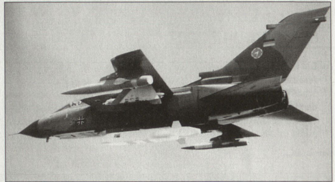
Kampfflugzeug «Tornado» mit Abstandslenkwanne «Taurus».

Ob allerdings die Bundeswehr mit den Truppenreduzierungen auf dem Balkan neue Handlungsfreiheit gewinnt, ist zweifelhaft. Denn parallel zum laufenden Einsatz in Afghanistan und zu Gunsten der Operation «Enduring Freedom» sind auch weiterhin Kontingente für SFOR, KFOR und TFF zu stellen. hg