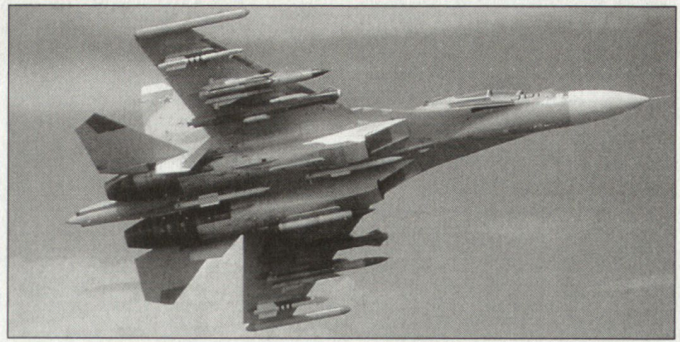
Prototyp des Kampfflugzeuges Su-30MK.

Gemäss Weisung des österreichischen Verteidigungsministers ist nach der Inkraftsetzung der Reorganisation eine zweijährige Erprobungsphase vorgesehen. Eine Evaluierung soll im Jahr 2005 erfolgen. hg