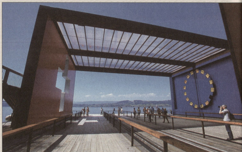
In der Werft in Murten wird das Thema «Sicherheit in der Offenheit» facettenreich dargestellt.

Für einmal ist die Armee nicht als Dienstleistungserbringer zugunsten der Landesausstellung, sondern als Instrument der Sicherheitspolitik dargestellt. In unmittel-