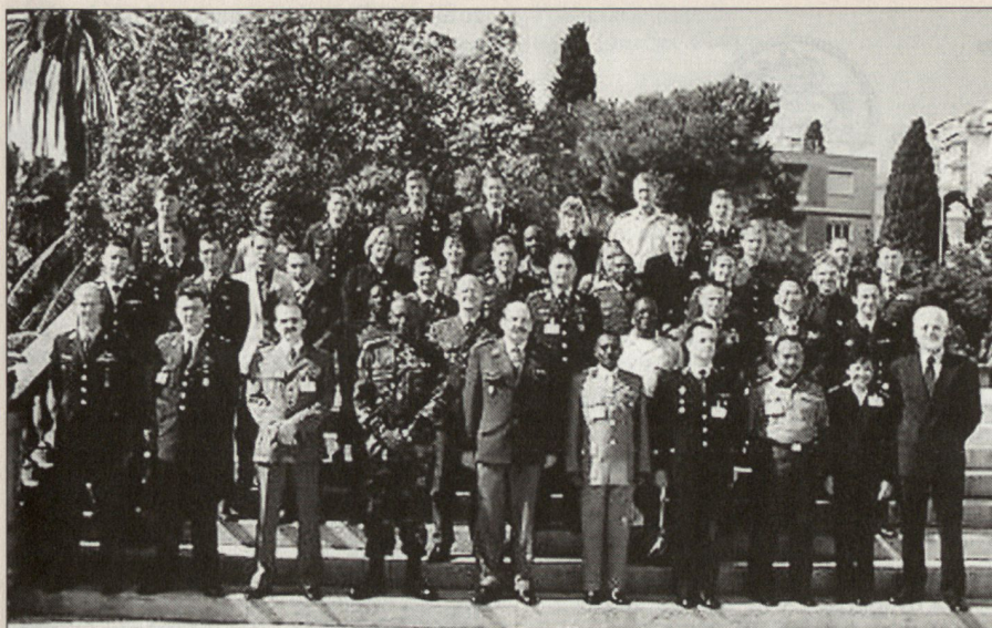
Kursleitung und Teilnehmer eines internationalen Kurses für Kriegsvölkerrecht.