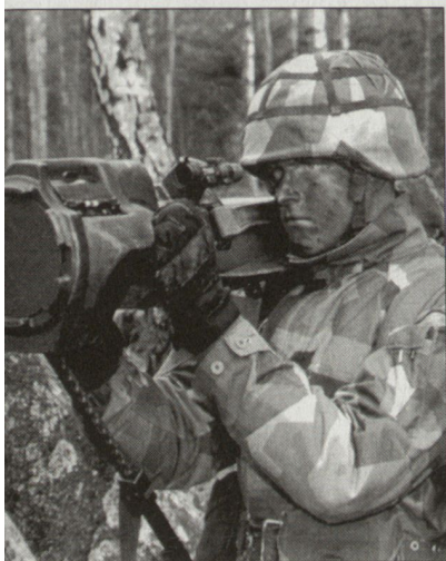
Die leichte Panzerabwehrwaffe NLAW.

Die Beschaffung der seit langem evaluierten neuen NLAW (Next-Generation Light Anti-Armour Weapon) für die British Army ist an die schwedische Firma Saab Bofors Dynamics vergeben worden. Der provisorische Vertrag