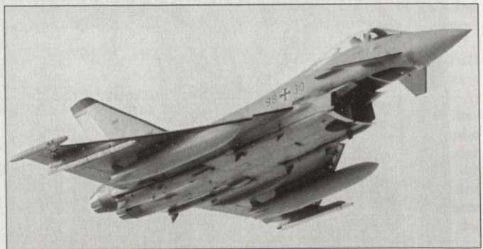
Kampfflugzeug Eurofighter «Typhoon».

ten im Jahr 2005 zur Verfügung stehen. Da die «Draken» schon 2003 aus dem Verkehr gezogen werden müssen, strebt das Verteidigungsministerium für die Übergangszeit die Zusammenarbeit mit einer «Referenzluftwaffe», vermutlich mit der deutschen Luftwaffe, an. Ausschlaggebend für den Typenentscheid war für die österreichische Regierung zum einen die technische Qualität des Eurofighters. Zum anderen verspricht das EADS-Konsortium die ergiebigsten Kompensationsgeschäfte. Die österreichische Regierung rechnet mit «Offset-Geschäften» in Höhe von rund 3,6 Mia. Euro, was sich nicht nur positiv auf den Arbeitsmarkt, sondern auch auf die Entwicklung im Hightechbereich auswirken soll. Zudem soll ein Drittel budgetwirksam werden, also in den Staatshaushalt zurückfliessen. Als nächsten Schritt wird Verteidigungsminister Scheibner mit dem Anbieter die Kaufverhandlungen führen. Wirtschaftsminister Bartenstein wird zusammen mit renommierten österreichischen Wirtschaftsforschungs-