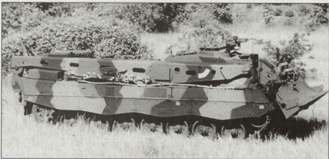
Bergepanzer auf Chassis «Leopard 2».

zösischen Bergepanzer «Leclerc» als auch an den südkoreanischen K1 angepasst. Der schwedische Bergepanzer verfügt gegenüber dem «Büffel» über einen verbesserten ballistischen Schutz einschließlich eines integrierten Splitterschutzes, eine reduzierte IR-Signatur, ein Führungs- und Navigationssystem, eine Waffenstation und über Nebelwerfer zur Selbstverteidigung. Ausserdem wurde ein Bergesystem unter Panzerschutz mit rückwärtigen Kameras integriert. Der Arbeitsbereich der Krananlage wird durch eine 1,5-t-Hilfswinde sowie mit der Leistungsfähigkeit des Dreifachzuges mit der Hauptwindenanlage (35 t Einfachzug) erhöht. Ausser Schweden haben auch die Schweiz und Spanien Verträge über insgesamt mehr als 40 Bergepanzer dieses Typs abgeschlossen. hg