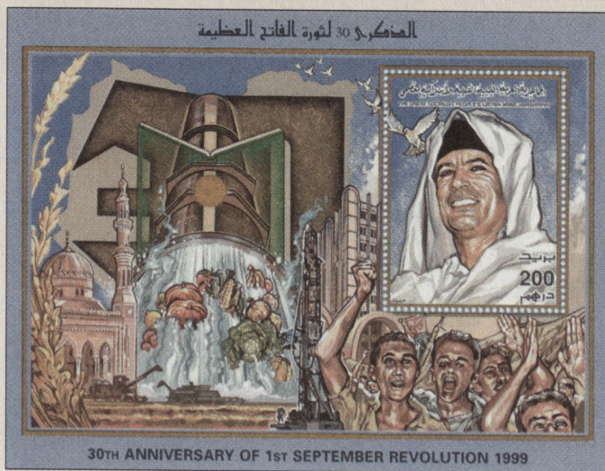
Der Sondermarkenblock zum 30. Jahrestag der Revolution vom 1. September 1969 zeigt den Grossen Vorsitzenden, Muammar al-Khadafi, und den Segen des von ihm initiierten «great man made river»-Projektes, das Wasser in alle Haushaltungen bringen soll.