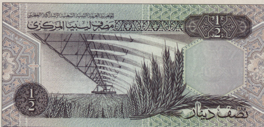
Der ½-Dinar-Geldschein preist den Segen des «great man made river»-Projektes, das durch die Bewässerung aus der Wüste ein Fruchtbild entstehen lässt.

«Wissen ist ein natürliches Recht jedes Menschen. Niemand hat das Recht, ihn dessen