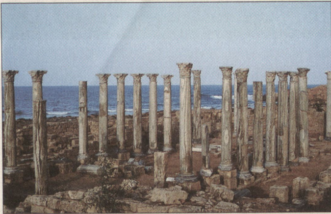
Apollonia: Der griechische Tempel wurde in byzantinischer Zeit, im 6. Jh. n. Chr., zur sogenannten Ostbasilika umfunktioni- niert.