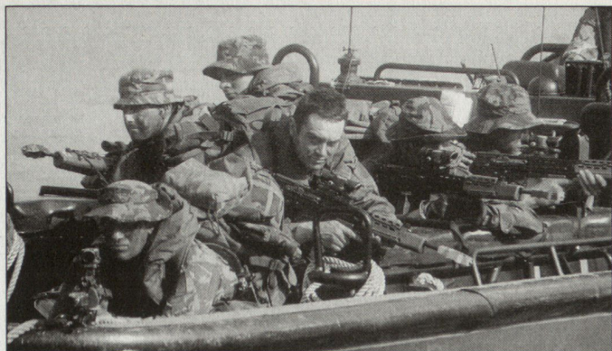
Royal Marines bei Manövern in Oman, die im Oktober 2001 stattgefunden haben.