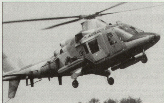
Helikopter A-109M von Agusta/Westland.

In den schwedischen Streitkräften werden die A-109M die heute veralteten Typen Bell 206 und CH-46 ersetzen. hg