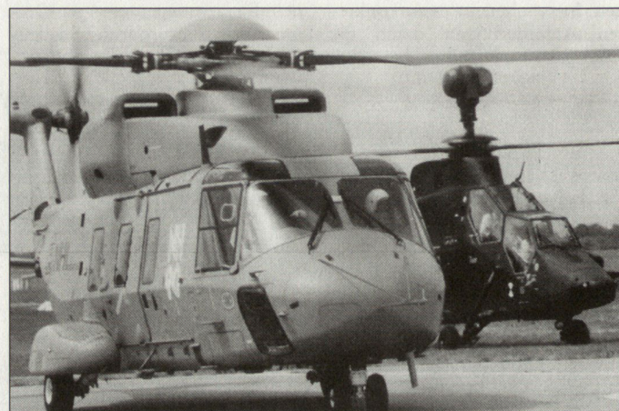
Produkte der europäischen Luftfahrtindustrie: Transporthelikopter NH-90 (links) und Kampfhelikopter «Tiger» (rechts).

Damit wird in Europa auch im Bereich der Transporthelikopter ein Zeichen für mehr Standardisierung gesetzt. hg