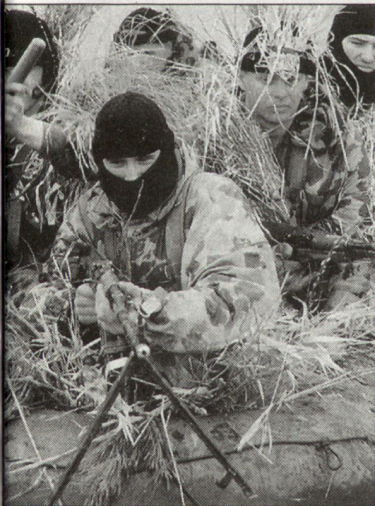
Soldaten der polnischen Spezialeinheit «Grom».

Bisher rekrutierten sich die Bestände der «Grom» hauptsächlich aus den polnischen Streitkräften, d.h. vornehmlich aus den Luftlandverbänden. Künftig will man die Rekrutierungsmöglichkeiten erweitern. Einen Schwachpunkt bilden bisher die eingeschränkten Lufttransportmöglichkeiten, wie sie bei Spezialtruppen moderner Streitkräfte üblich sind. Hier ist die polnische Spezialeinheit weiterhin auf die Unterstützung durch NATO-Partner angewiesen. hg