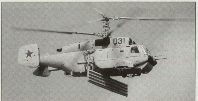
Produkte der russischen Luftfahrtindustrie: Überwachungshelikopter Ka-31.

Dominierende russische Firma im Kampfflugzeugbereich ist heute Suchoi. Es scheint, dass dieser Hersteller den langjährigen Konkurrenzkampf gegenüber den MiG-Werken zu seinen Gunsten entschieden hat. Neben zahlreichen anderen Typen nahmen von Suchoi die bekannten Prototypen an den Flugvorführungen teil, z.B. die S-37 «Berkut», die nunmehr unter der Bezeichnung Su-47 geführt wird. Vorgeführt wurde auch der dritte Prototyp des Zweisitzers Su-30MKI in der Version, wie sie nun an Indien geliefert werden soll. Dazu kam zum ersten Mal die Su-35UB, ebenfalls ein Doppelsitzer, der sich noch im Prototypenstadium befindet. Der Hersteller MiG beschränkte sich vor allem auf die Präsentation von kampfwertgesteigerten Maschinen der MiG-29-Serie sowie auf das