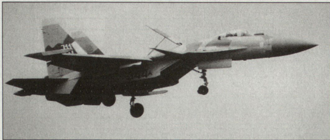
Kampfflugzeug Su-47 «Berkut».

Schul- resp. leichte Kampfflugzeug MiG-AT.