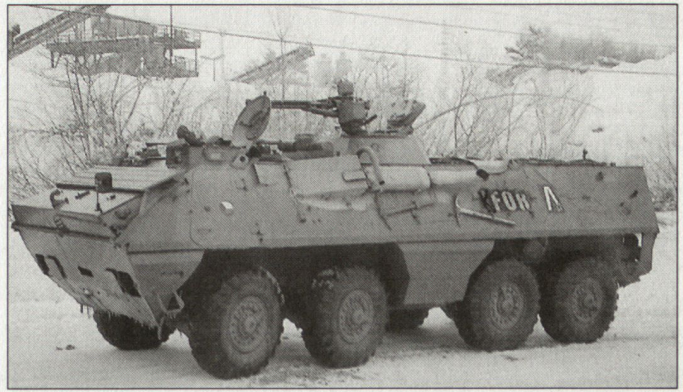
Schützenpanzer OT-64 des tschechischen KFOR-Kontingents.

Die tschechische Armee wollte sich ursprünglich aus dem Kosovo (KFOR) zurückziehen, um sich verstärkt auf die SFOR in Bosnien-Herzegowina konzentrieren zu können. Es scheint, dass diese Absicht von der NATO nicht akzeptiert worden ist und der NATO-Partner Tschechien angewiesen worden ist, sich noch ver-