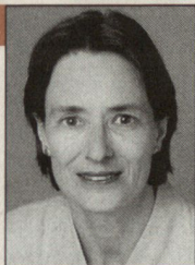
Barbara Haering, Dr., Nationalrätin.

■ Die Vorwarnzeiten für traditionelle Kriege sind in Europa auf mindestens zehn Jahre angewachsen.