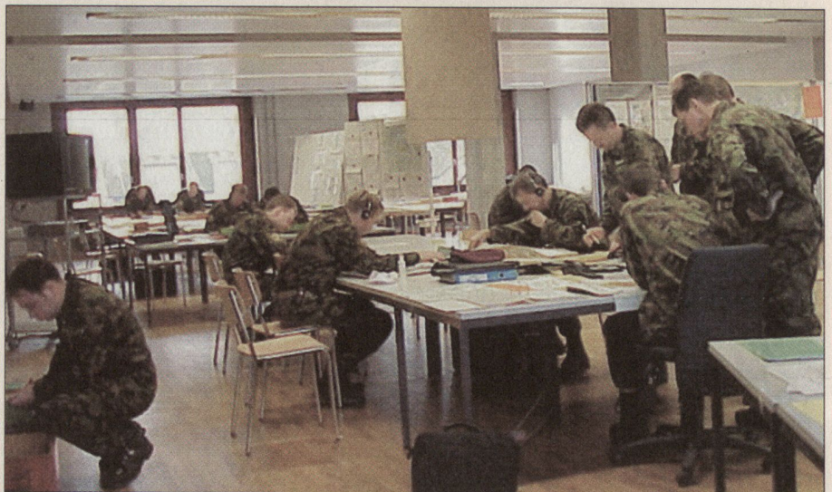
Der Führungssimulator 95 ist von der Ausbildung unserer Stäbe Stufe Bataillon bis Brigade nicht mehr wegzudenken.

■ Ausbau der Übungsinfrastruktur für mehr Direktunterstelle (modularer Brigadetyt XXI),