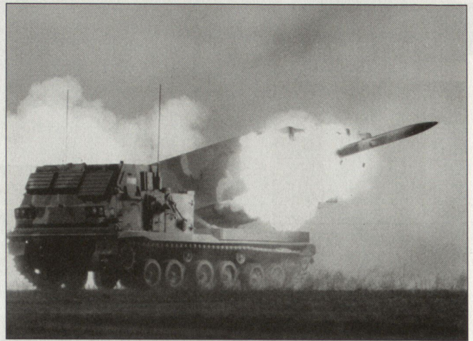
Entwicklung einer gelenkten Rakete für den Mehrfachraketenwerfer MLRS.

Beim laufenden multinationalen Programm werden möglichst viele Komponenten der Basisrakete des MLRS (Kaliber 227 mm) übernommen. Auch in der Lenkeinheit der neuen Rakete, die zirka 50% der Stückkosten ausmacht, werden bereits eingeführte Komponenten verwendet. So wurde die Lenkeinheit mit GPS-Empfänger-, Inertiallenkung und mit einer flexiblen elektronischen Zündeinrichtung ausgerüstet, die auch die Verarbeitung von Signalen für intelligente Sub-Munitionen ermöglichen soll. Die Entwicklung der neuen GMLRS ist somit auch eine viel versprechende Basis für eine neue Munitionsfamilie für das MLRS-Waffensystem. hg