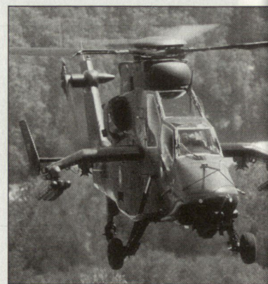
Französische Version des Kampfhelikopters «Tiger», der sich auch für Aufklärungsmissionen eignet. ■

■ eine Automatenkanone 30 mm M781 von Giat