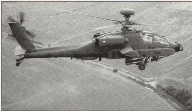
Kampfhelikopter AH-64D «Apache Longbow».

Datalink digitalisierte Informationen über das Gefechtsfeld oder das überflogene Krisengebiet an luft- und/oder bodengestützte Einheiten und Führungsstellen weiterleiten.