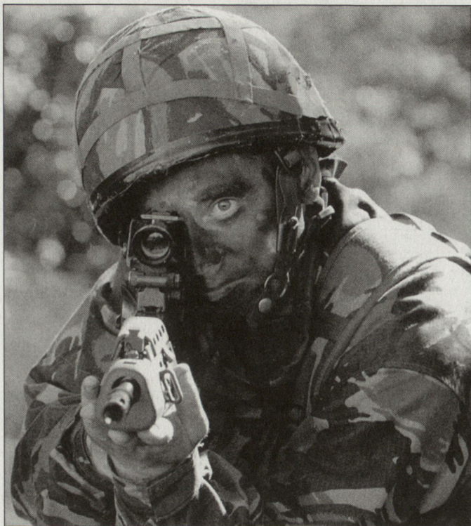
Britische Truppen sollen bei künftigen Auslandseinsätzen ausschliesslich mit dem verbesserten Sturmgewehr SA80 A2 ausgerüstet werden.

Zielfernrohr sowie über weitere technische Verbesserungen.