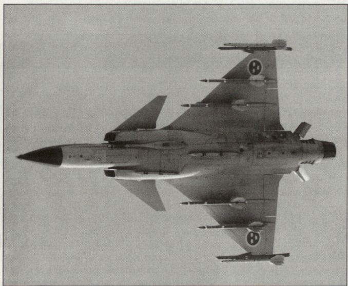
Kampfflugzeug JAS-39 «Gripen».

Zusammen haben das Verteidigungs- und das Finanzministerium einen Vorschlag zur Finanzierung der Flugzeuge erarbeitet, der nun der tschechischen Regierung unterbreitet werden soll. Grundsätzlich soll diese umfangreiche Beschaffung über Kredite finanziert werden, die allerdings noch vom Parlament bewilligt werden müssen. Der Gesamtumfang der Flugzeugbeschaffung dürfte sich demnach zusammen mit den auflaufenden Zinsen für