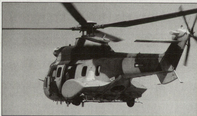
Transporthelikopter «Cougar Mk2» für das französische COS.

Zudem wird mit den zur Verfügung gestellten Budgetmitteln der Kauf von 10 zusätzlichen Transporthelikoptern «Cougar Mk2» ermöglicht. Diese Beschaffung soll so rasch als möglich durchgeführt werden, damit die Transportkapazität verbessert werden kann. Bereits heute verfügt das COS über einige wenige Helikopter dieses Typs. hg