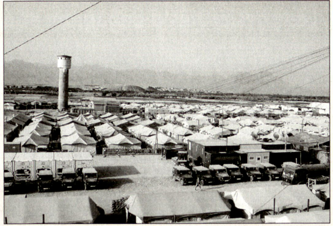
Lager in Afghanistan.