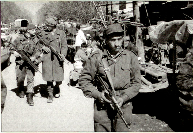
Die deutsche und die afghanische Patrouille in Kabul.