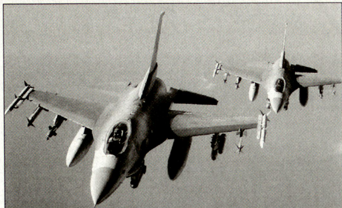
Amerikanische Kampfflugzeuge F-16C für die polnische Luftwaffe.

ten zählen nebst Polen auch Tschechien, Ungarn, Bulgarien, Rumänien sowie in beschränktem Masse auch die Baltischen Staaten. Die US-Firmen profitieren dabei von starkem politischen Rückenwind und grosszügigen Finanzierungsangeboten, die von den Europäern nicht gekontert werden können. Hinzu kommt, dass heute die meisten der umworbenen osteuropäischen Staaten politisch den USA näher stehen als der EU oder zu meisten westeuropäischen Partnerstaaten. Dies kommt u. a. auch