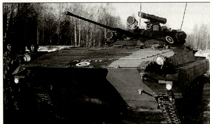
Mittel der neuen «Raschen Einsatzbrigaden» Kampfschützenpanzer BMP-2.

Die drei «Readiness-Brigaden» oder Brigaden 2005 sind das Kernelement des künftigen Heeres; sie verfügen über eine wesentlich höhere Einsatzbereitschaft als die übrigen Kampfverbände. Die