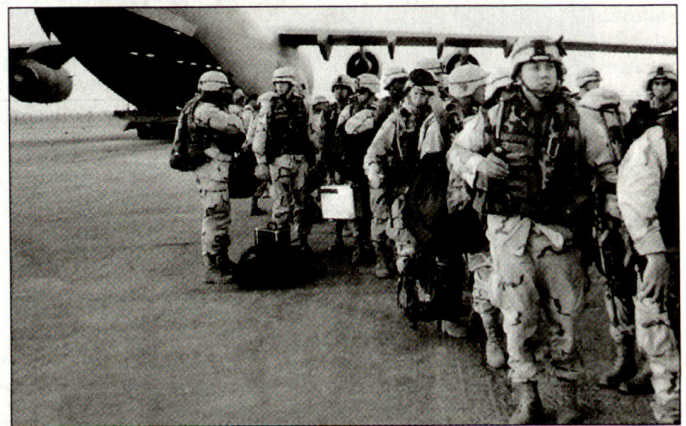
Unter den in die Golfregion verlegten US-Truppenteilen befinden sich auch Einheiten aus Deutschland.

Truppen in Europa dürfte auch stark davon abhängen, wie lange der laufende Golfkrieg dauert, wie hoch sich die diesbezüglichen Kosten belaufen werden und welche Truppenpräsenz über die nächsten Monate und Jahre im Irak belassen werden müssen. Bekanntlich stehen auch amerikanische Kräfte aus Deutschland im laufenden Golfkrieg im Einsatz. Dazu gehören insbesondere Truppen des Kommandos des V. US-Korps in Europa. Kurzfristig dürften sich aber, trotz Kritik amerikanischer Politiker, keine wesentlichen Dislozierungsveränderungen bei den US-Truppen in Europa ergeben. hg