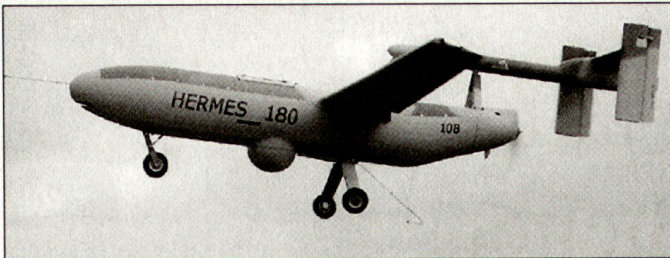
Israelische Aufklärungsdrohne «Hermes 180».

war bisher daran, für die Streitkräfte eigene Infanteriewaffen zu entwickeln. Diese Beschaffung eines ausländischen Produktes lässt aber den Schluss zu, dass bei den auf russischen Sturmgewehren basierenden Eigenentwicklungen Probleme aufgetaucht sind. Erste Serien der indischen Eigenentwicklung «Insas» von Kaliber 5,56 mm wurden bereits in den 90er-Jahren der Truppe zugeführt. Indien ist