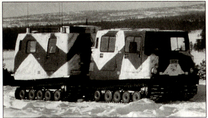
Kettentransporter Pbv 206 von Hägglunds.

«Readiness-Brigaden» werden auf die drei Wehrbereiche Nord (Kajaani), West (Käkylä) und Ost (Vekaranjärvi) aufgeteilt.