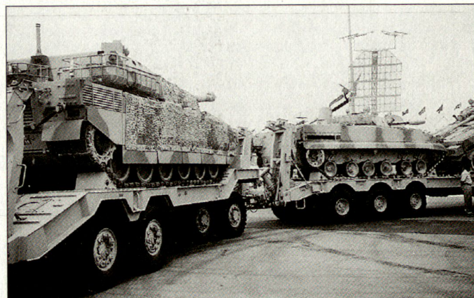
Schwere Lastwagen mit Tiefladeanhänger aus weissrussischer Produktion für die Armee der VAE.

Viele Rüstungsproduzenten hoffen, dass der laufende Irak-Krieg den etwas abgeflauten Rüstungsmarkt in der Golfregion wieder in Schwung bringen wird. Hauptbeweggrund für die meisten Rüstungsfirmen, die sich um Aufträge bei den Armeen der Golfstaaten bemühen, wobei vor allem die Staaten des GCC von Interesse sind. Unter den neuen an IDEX 2003 präsenten Rüstungsproduzenten waren u. a. Staaten wie Kasachstan, Iran, Jordanien, Malaysia, Südkorea, Kroatien, Serbien usw. hg