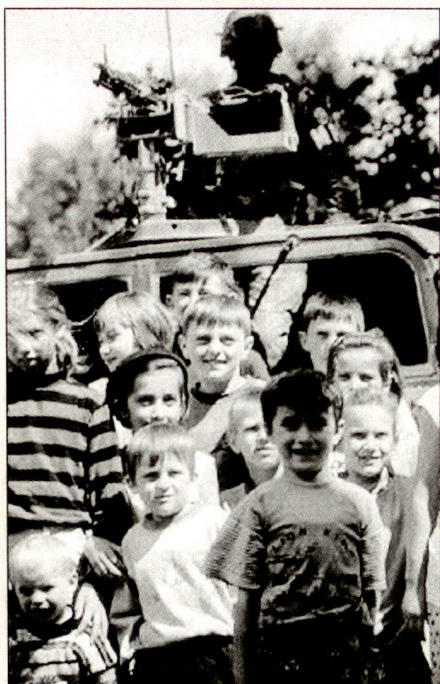
KFOR Soldaten bewachen eine Schule in Bosnien.

deren Schicksal es aber eigentlich geht, werden zur Nebensache.