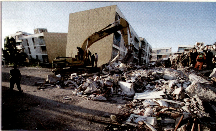
Für den schweren Rettungseinsatz sind Geräte und Maschinen unerlässlich.

den Rettern gleichzeitig ganz wichtige Hinweise für die Such- und Rettungsarbeiten.