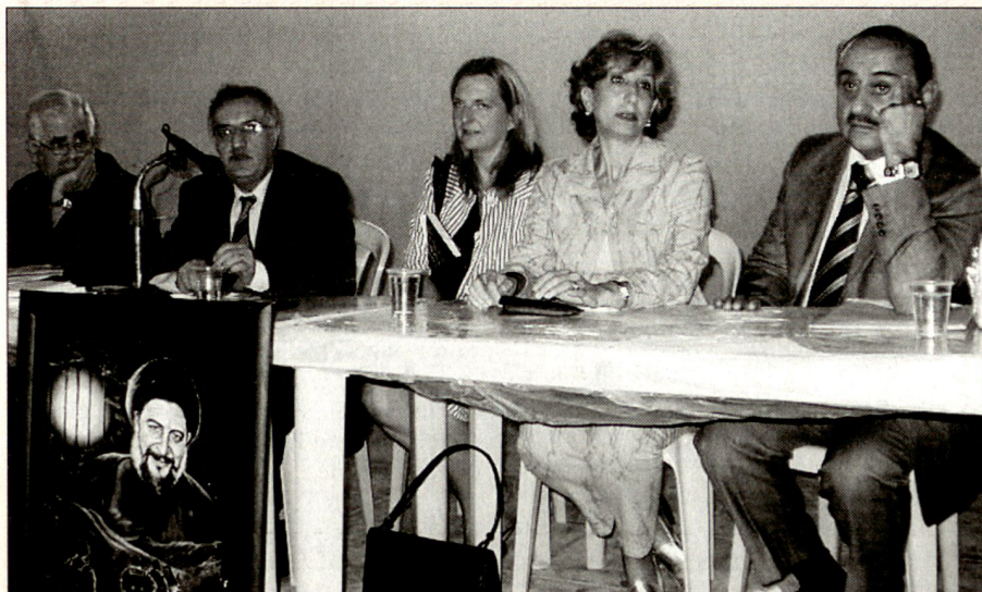
Mitte September fand in Nabi Schi'it in der libanesischen Bekaa ein Symposium zum Erbe des Imam Musa Sadr statt. Über alle Konfessionen hinweg genießt Musa Sadr weiterhin hohes Ansehen, sodass sich Muslime, ebenso wie maronitische Geistliche und säkulare Schiiten mit seiner Rolle akademisch und gesellschaftlich befassen.