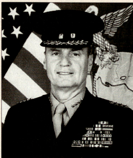
General James Jones, der NATO-Oberbefehlshaber in Europa.

Zu Beginn der «heissen» Übungsphase erhielt der Kommandant der GFOR den