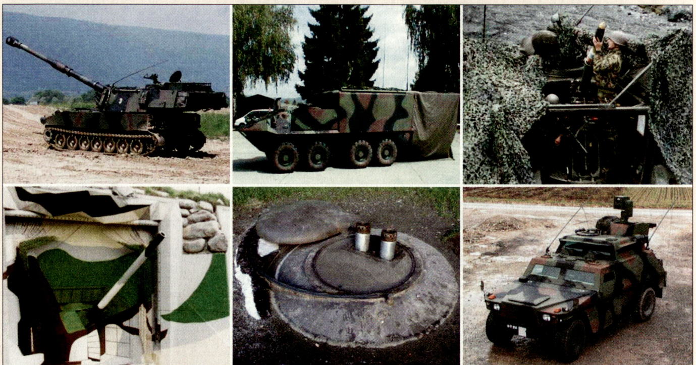
Wichtige Systeme im Lehrverband Artillerie: Kampfwertgesteigerte Panzerhaubitze M-109, Führungsfahrzeug Piranha IIC, Panzerminenwerfer M-113, Festungskanone BISON, Festungsminenwerfer und Schiesskommandantenfahrzeug (v. l. n. r.).

Grundsätzlich geht es um die Sicherstellung der Ausbildung der taktischen Einheit in der Grundausbildung und um das Erstellen bzw. um das Überprüfen der Grundbereitschaft der Abteilungen und Einheiten. Was bezüglich artilleristischem Können in der A 61 erreicht und in der A 95 leider verloren ging, muss mit der neuen Armee wieder erarbeitet werden. Für eine glaubhafte und sichere Feuerunterstützung dürfen wir uns in der Ausbildung und Führung keine Halbheiten erlauben. Dabei sind aber auch die Miliz und vorab die Kader gefordert.