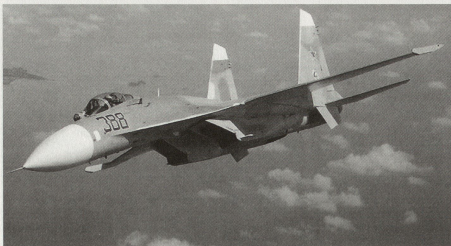
Su-27 ist die modernste russische Kampfflugzeugplattform und wird kontinuierlich weiterentwickelt. Sie bildet zusammen mit MiG-31 und MiG-29 das Rückgrat der fliegenden Luftverteidigung.

Im Folgenden sollen einige Beispiele die Hürden, mit der der Modernisierung der Streitkräfte konfrontiert ist, illustrieren. Vor allem die Unterfinanzierung der Streitkräfte stellt die laufende Reform vor grosse Schwierigkeiten. 2001 liess sich Russland das Militär nur noch halb so viel kosten wie zehn Jahre zuvor. Die Armee ist rundum reformbedürftig. Das zeigt sich auch in der