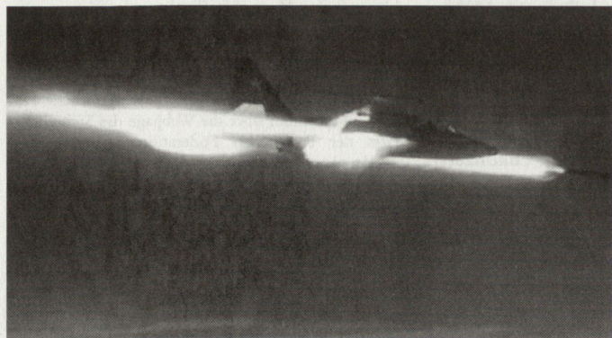
In Tschetschenien ist der Erdkämpfer Su-25 von grossem Nutzen, bringt aber keine Präzisionsfähigkeit ein.

Tschetschenien, flächenmässig knapp halb so gross wie die Schweiz, stellt für Russland immer noch eine der grössten innen- und militärpolitischen Herausforderungen dar. Im 19. Jahrhundert war Tschetschenien der blutigste Schauplatz der russischen Expansion. 47 Jahre brauchten die Zaren, um den Widerstand des Bergvolkes zu brechen. Erst 1864, nach Armenien, Georgien und Aserbaidschan, wurde Tschetschenien unterworfen. Während der Sowjetzeit (1922–1991) durchlebte das kleine Land eine wechselvolle Geschichte mit Enteignung und Kollektivierung der Landwirtschaft, Deportationen unter dem Vorwand der Kollaboration mit