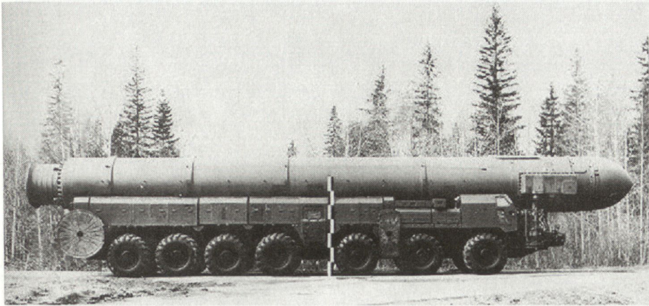
Die strategischen Raketentruppen verfügen hauptsächlich über SS-18 ICBMs, diese werden durch jährlich zirka sechs neue SS-27 Topol-M langsam ersetzt (Bild: SS-25 Topol).

rund 25%. 22 Der Artillerie und den Raketentruppen fehlen auf Stufe Zug und Batterie ein Drittel Offiziere. Der Zustand der Bewaffnung und des Materials wird hier von den verantwortlichen Stellen ebenfalls als den heutigen Anforderungen unzureichend eingeschätzt. 23 Die Liste der Kritik und Verbesserungspotenziale ist lang.