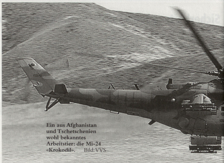
Ein aus Afghanistan und Tschetschenien wohl bekanntes Arbeitstier: die Mi-24 «Krokodil».

Umso mehr steht Russland aussen- und sicherheitspolitisch vor grossen Herausforderungen. 2003 ist deutlich geworden, dass der Krieg gegen den Terrorismus international noch lange nicht gewonnen ist. Er wird auf absehbare Zeit eine der grössten Herausforderungen für die westliche und alle entwickelten Gesellschaften sein. Trotz der organisatorischen Schwächung des internationalen Terrornetzes, insbesondere