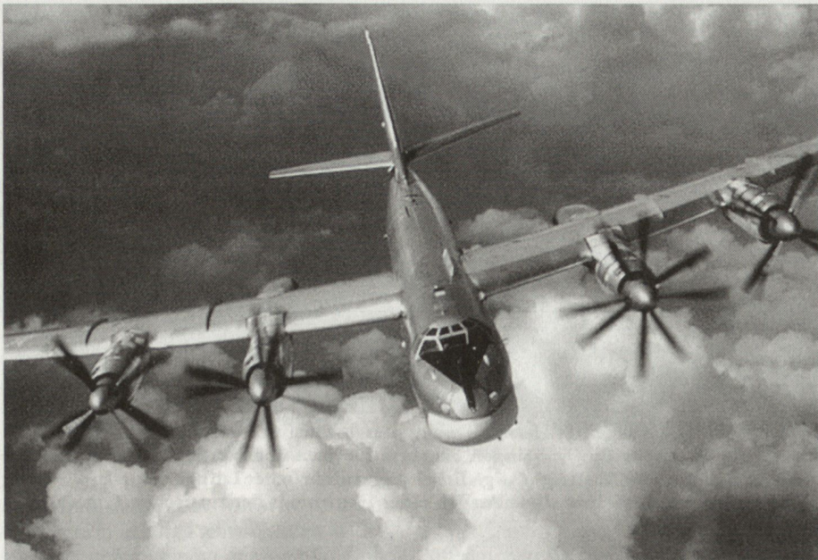
63 Tu-95MS bilden das Rückgrat des fliegenden Standbeins der nuklearen Triade. Sie sind in Ukrainka und Engels stationiert.

ungerechten Krieg. Ebenfalls unterschieden wird zwischen konventionellen und nuklearen Kriegen. Der Weltkrieg wird zum grossmassstäblichen Krieg. Unterschieden wird auch der regionale und lokale Krieg. Die Doktrin lässt offen, welche der genannten Kriegsorten eine höhere oder geringere Wahrscheinlichkeit besitzen. Heute müssen die Streitkräfte zu defensiven und offensiven Handlungen gleichermaßen in der Lage sein und auch unter Bedingungen des Einsatzes von Massenvernichtungswaffen einsatzfähig bleiben.