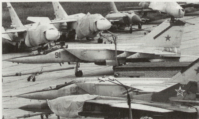
Die Masse älterer Typen wurden bis Ende der 90er-Jahre ausgemustert und stillgelegt.

tens die internationale militärische Zusammenarbeit. 14 Sie sind Ausdruck des Reformverständnisses unter Präsident Putin. Bereits vor seiner Wahl zum Präsidenten im März 2000 unterzeichnete er Anfang Januar 2000 ein neues Sicherheitskonzept, das jenes von 1997 ersetzt. Gemäss der Neufassung behält sich Russland den Einsatz von Nuklearwaffen vor, wenn im Falle einer bewaffneten Aggression alle anderen Mittel erschöpft sind oder sich als unwirk-