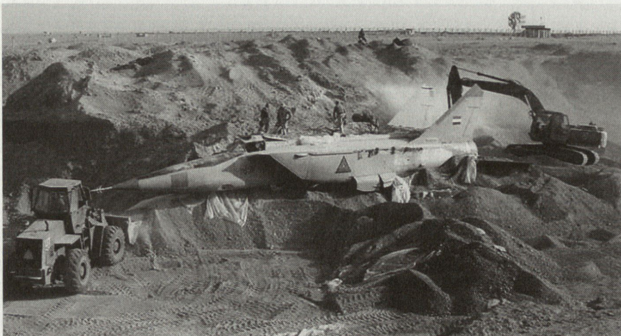
Beispiel einer kolossalen Fehlinvestition in den letzten Jahren: Die irakische Luftwaffe vergrub sich im Sand, Anzahl Einsätze während OIF = 0.