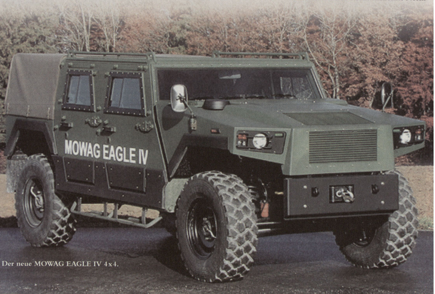
Der neue MOWAG EAGLE IV 4x4.

Im Hinblick auf die in zahlreichen Streitkräften anstehenden Ersatzinvestitionen für leichte Transport- und Verbindungsfahrzeuge wird dem Schutz der Besatzung aufgrund der aktuellen Bedrohungslage sowie für UN-Missionen eine immer stärkere Bedeutung beigemessen. Der EAGLE IV erfüllt im Schutz gegen ballistische Waffen die internationale Norm