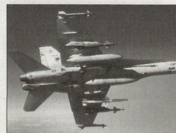
F/A-18 der spanischen Luftwaffe.

Im Januar 2004 hat die spanische Luftwaffe mit der Kampfwertsteigerung ihrer Kampfflugzeuge F/A-18 begonnen. Im Verlaufe der nächsten vier Jahre sollen insgesamt 65 F/A-18 bei den spanischen Flugzeugwerken CASA/EADS modernisiert und auf den neusten Stand gebracht werden. Geplant ist, dass monatlich eine Maschine den Werken in Getafe zugeführt wird; die ersten der kampfwertgesteigerten Flugzeuge sollen gegen Ende 2004 an die Luftwaffe zurückgehen. Die Gesamtkosten der Kampfwertsteigerung betragen gemäss Planung rund 190 Mio. Euro. Das Modernisierungspaket umfasst im Wesentlichen neue Software für Avionik, Navigation und Kommunikation, die beim CLAEX (Centro Logistico de Armamento y Experimentación) der spanischen Luftwaffe entwickelt worden ist. Die neue Technologie erfordert auch entsprechende Anpassungen bei