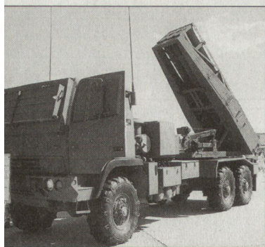
Leichter Raketenwerfer HIMARS der US Army.

Im Frühling 2003 sind erste Waffensysteme HIMARS u. a. auch im Irakkrieg eingesetzt worden. Sie sind als Unterstützungswaffen für die künftigen leichten Brigaden vorgesehen. Die aktuelle US-Streitkräfteplanung sieht die Beschaffung von insgesamt 900 Waffensystemen HIMARS vor. Im Gegensatz zum Mehrfachraketenwerfer MLRS auf Kettenfahrzeuggestell kann der HIMARS mit herkömmlichen Transportflugzeugen verlegt werden. Zudem kann auch mit dem HIMARS die gesamte MLRS-Munitionsfamilie einschliesslich des Army Tactical Missile System (ATACMS) und der neu entwickelten Lenkraketen (GMLRS) verschossen werden. Die ersten Waffensysteme HIMARS aus der Serienproduktion sollen im Jahre 2005 der US Army zulaufen. hg