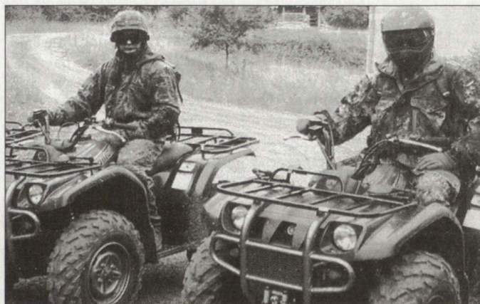
Die neuen «Kodiaks» für das Kommando Spezialkräfte der deutschen Bundeswehr.

Aktionsradius der Kommandotrupps zu erweitern. Neben einem Aufklärungs- und Gefechtsfahrzeug (AGF) auf der «Wolf»-Basis sowie Motorrädern vom Typ KTM 640 verfügt das KSK nun auch über ATVs (All-Terrain-Vehicles). Ausgewählt wurde dabei