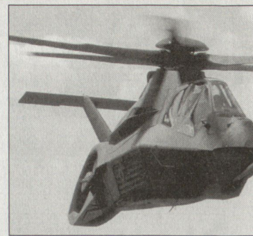
Das aufwändige Entwicklungsprogramm des Kampfhelikopters «Comanche» wurde gestoppt.

■ Entwicklung weiterer unbemannter Luftfahrzeuge, die insbesondere über grössere Reichweiten und eine erhöhte Einsatzdauer verfügen; dafür werden in den