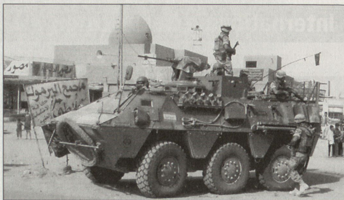
Spanischer Schützenpanzer BMR-M1 im irakischen Nadschaf.

Innerhalb der spanisch geführten Brigade im Irak sind auch Kontingente aus El Salvador, Hon-