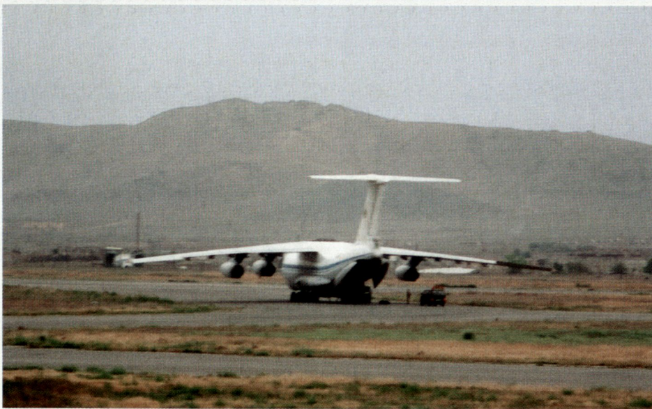
Russisches Transportflugzeug Ilyushin IL-76.