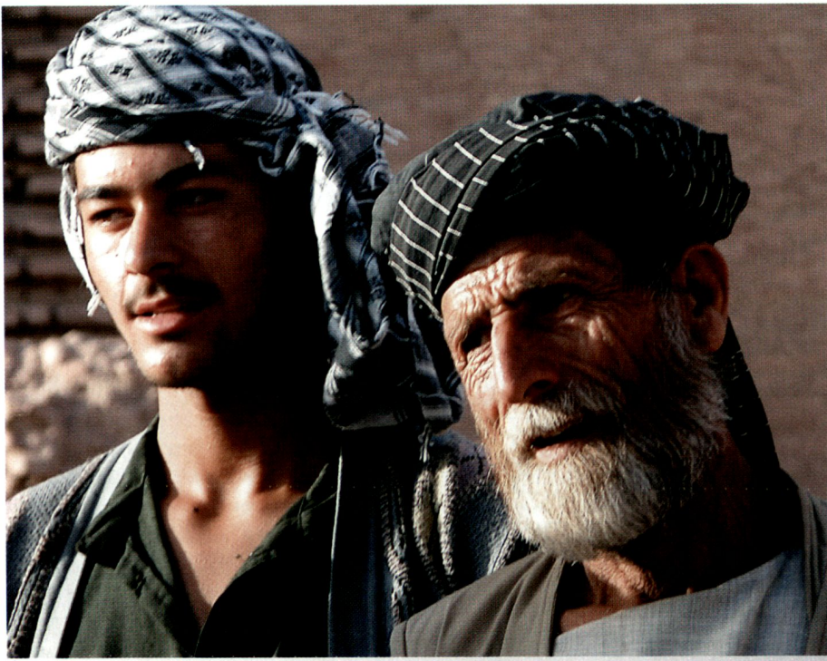
Zwei Generationen in Herat.