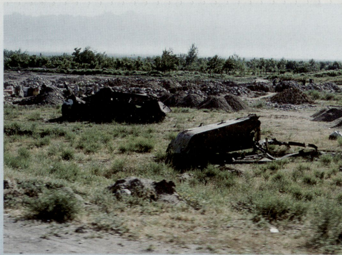
Zerstörter Talibanpanzer in der Shomali-Ebene nördlich Kabul.