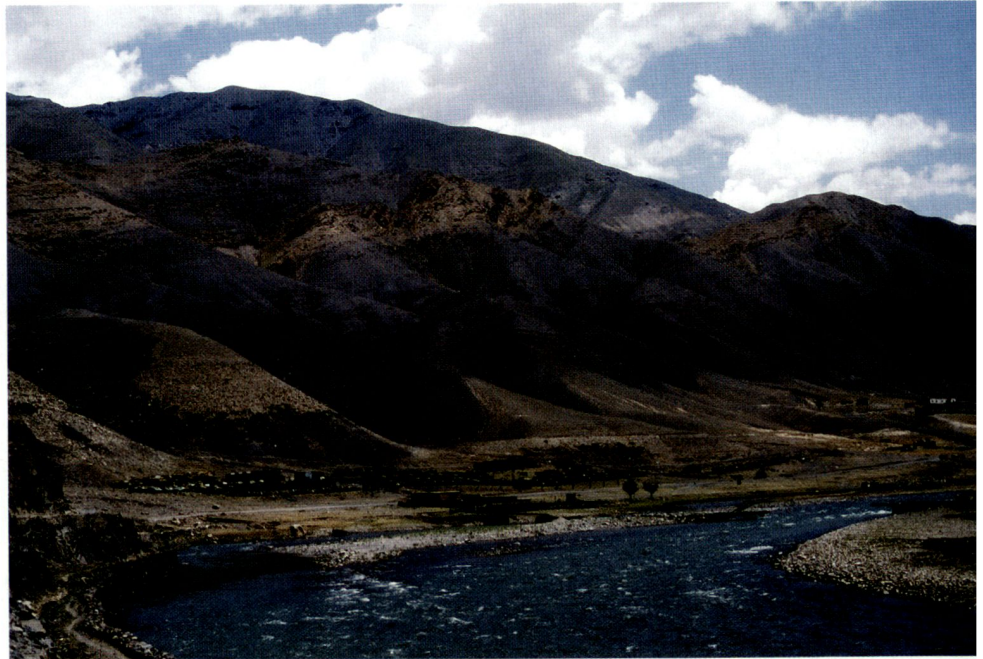
Panjshir-Tal. Im Hintergrund das Arsenal von Marschall Fahim.

Mein nächster Vorschlag ist, dass die Schweiz ein Institut für Frieden und Freiheit in Afghanistan gründet. Dieses