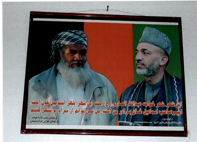
Ismael Khan und Hamed Karzai. Wie stark ist die Zentralregierung?

Institut sollte die wirkliche Situation in Afghanistan analysieren und der afghanischen Regierung und den Institutionen innerhalb von Afghanistan mit Ratschlägen zur Seite stehen. Ich weise darauf hin, dass Afghanistan bald einen schlechten Ruf haben und von der ganzen Welt geächtet sein wird, wenn gegen den Drogenanbau und den Drogenhandel nichts unternommen wird. Leider ist, seitdem die so genannten «Freunde» nach Afghanistan gekommen sind, der Drogenanbau gestiegen und nicht gesunken.