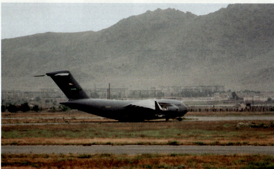
Unten: Amerikani- sches Transportflug- zeug Boeing C-17 A.

Warum erlaubt sich die Welt, sich in unsere Angelegenheiten einzumischen? Der eine will für uns eine nationale Armee aufbauen, der andere eine nationale Polizei, der andere will uns ein politisches System übertragen und ein anderer etwas anderes. Es ist offensichtlich, dass wir selbst für Sicherheit und Frieden in unserem Land zuständig sind. Trotzdem sendet man die NATO und andere Kräfte zu uns, um sich gegen uns zu verteidigen! Sollten sie uns nicht fragen, ob wir diese Truppen für unsere Sicherheit wirklich benötigen? Oder sollten wir nicht selbst entscheiden dürfen und dann um Kräfte bitten? Ich glaube, dass der Kampf gegen den Drogenanbau oder Drogenhandel und die Wiederherstellung der Sicherheit zu besseren Ergebnissen führen wird, wenn mit den Afghanen eine Verständigung herbeigeführt wird, als wenn es andere ohne uns Afghanen tun. Ich zum Beispiel trage in einem Teil Afghanistans die