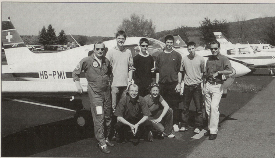
Fluglehrer und Teilnehmer eines der ersten SPHAIR-Kurse im April 2004 im Birrfeld.

halb fatal, auf Grund der aktuellen Situation Ausbildungsgefässe, wie z. B. die FVS, auslaufen zu lassen.