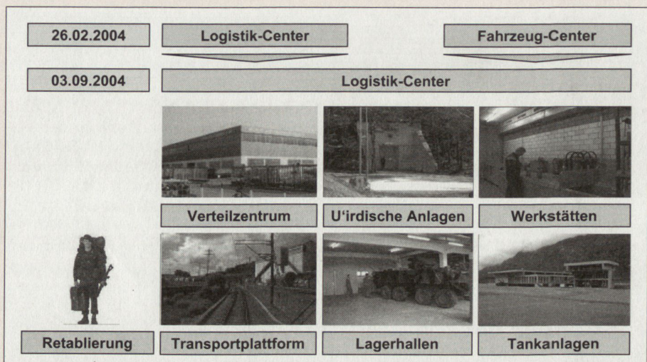
Jedes Logistikcenter ist modular aufgebaut.

Ja. Outsourcing wird bereits in vielen Armeen praktiziert. Norwegen beispielsweise kauft enorm viele Leistungen ein, weil der Armee das Geld für Investitionen fehlt. Das Verhältnis der norwegischen Armee von Betriebs- zu Investitionskosten beträgt 90 zu 10 Prozent! Das ist eine völlig andere Strategie als bei uns. Denn mit Outsourcing wird eigenes Können abge-