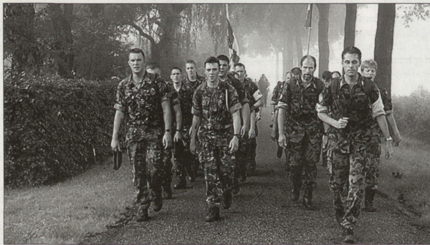
Eine britische und eine schweizerische Marschgruppe gemeinsam unterwegs.

Einerseits verlangt der Marsch jeweils von den Teilnehmern ein Höchstmass an Ausdauer und Durchhaltewillen, andererseits bietet der Grossanlass der Bevölkerung Anlass zu einem Volksfest. Der Marsch und die Teilnehmer geniessen in der Bevölkerung ausserordentlich viel Sympathie und Ansehen. Zehntausende von Zuschauern samt unzähligen Musikkapellen säumen jeweils die Strassen, um die Marschierenden zu feiern und anzuspornen. Daneben gibt es auch ernste Momente: Die schlichte und eindrückliche Andacht der Schweizer Delegation auf dem kanadischen Militärfriedhof nahe Groesbeek rief in Erinnerung, dass Europas Freiheit mit einem hohen Blutzoll erkauft wurde. Text und Foto: Ivo Stalder