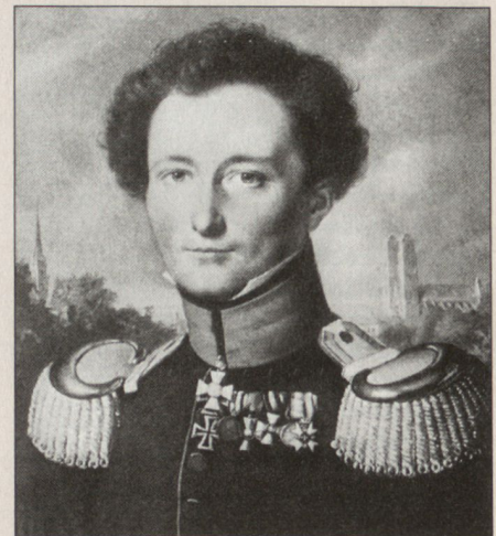
Carl von Clausewitz weilte mit Prinz August im Herbst 1807 längere Zeit auf Schloss Coppet am Genfer See (Schramm, a.a.O., S. 98).

In seinen späteren Aufzeichnungen hat er die militärische Bedeutung der Schweiz