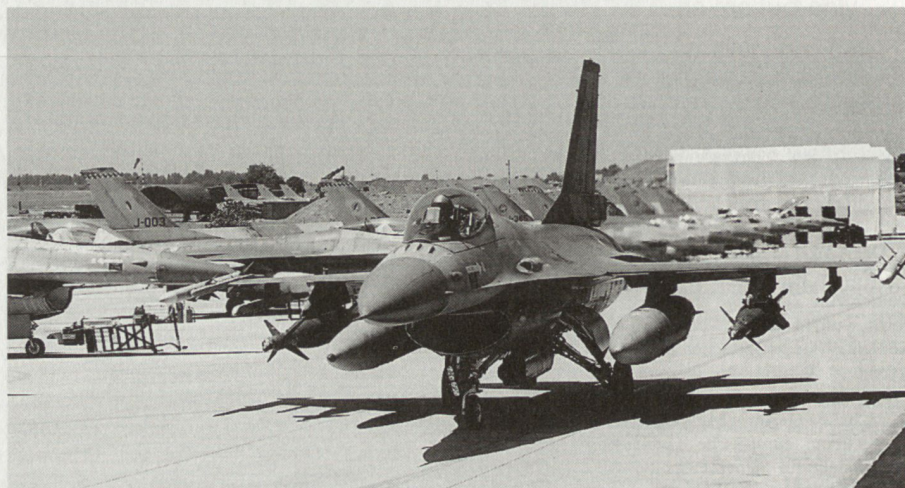
Eine kampfwertgesteigerte F-16, bewaffnet mit AMRAAM-Raketen und zwei laser-gelenkten Bomben auf dem süditalienischen Militärflugplatz Amendola.

Die systematische Unterdrückung der ethnisch albanischen Mehrheit im Kosovo durch die Zentralregierung in Belgrad veranlasste die Regierungen der NATO-Staaten, öffentlich eine militärische Intervention zu diskutieren. Nachdem die dip-