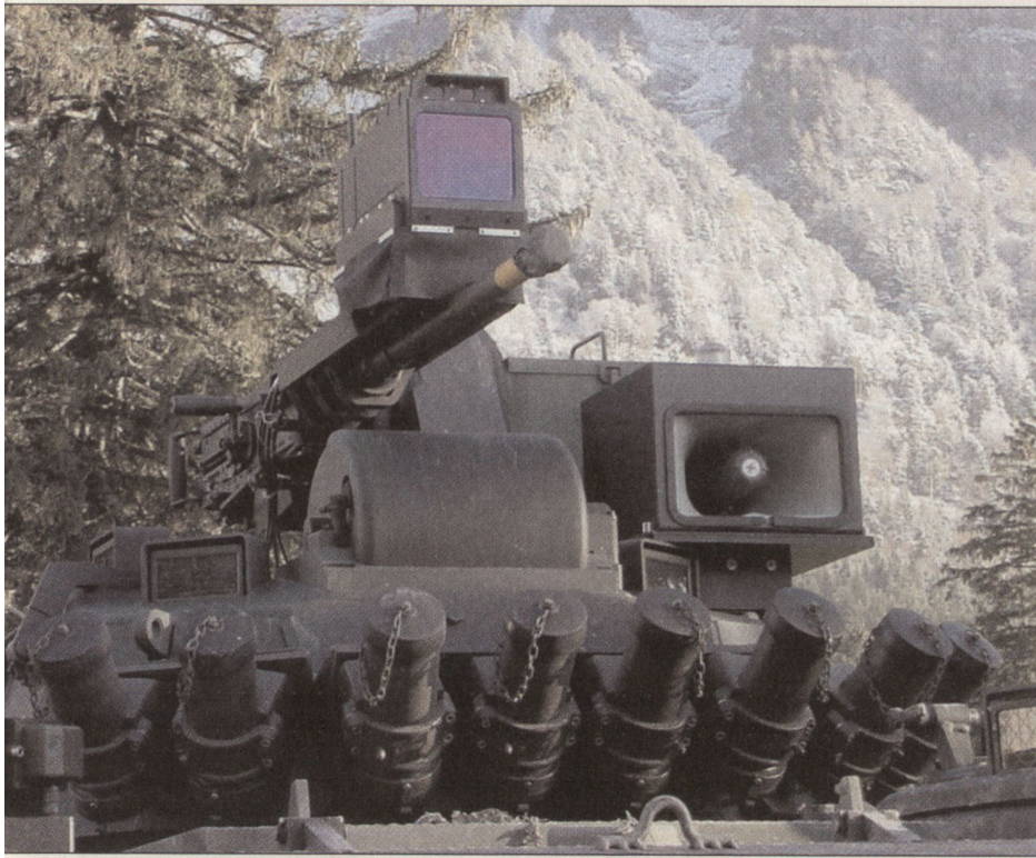
Rad Spz mit aufgebautem LASSIM (Laser-Simulationssystem).

derung in den Bereichen konventionelle Kriegführung, asymmetrische Kriegführung, Other Operations Than War, Einsätze unterhalb der Kriegsschwelle, subsidiäre Einsätze oder kurz gesagt über das ganze Einsatzspektrum einer modernen Armee.