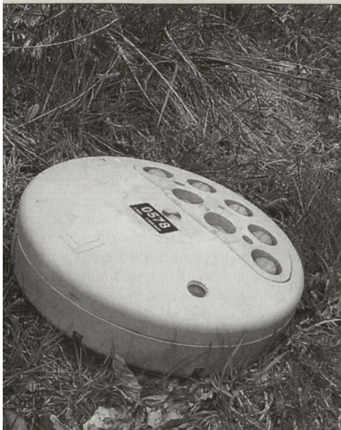
Signaturkörper (Feldkomponente zur Darstellung des Art/Mw-Feuers und zur Wirkungsübertragung) Stand Prototyp.