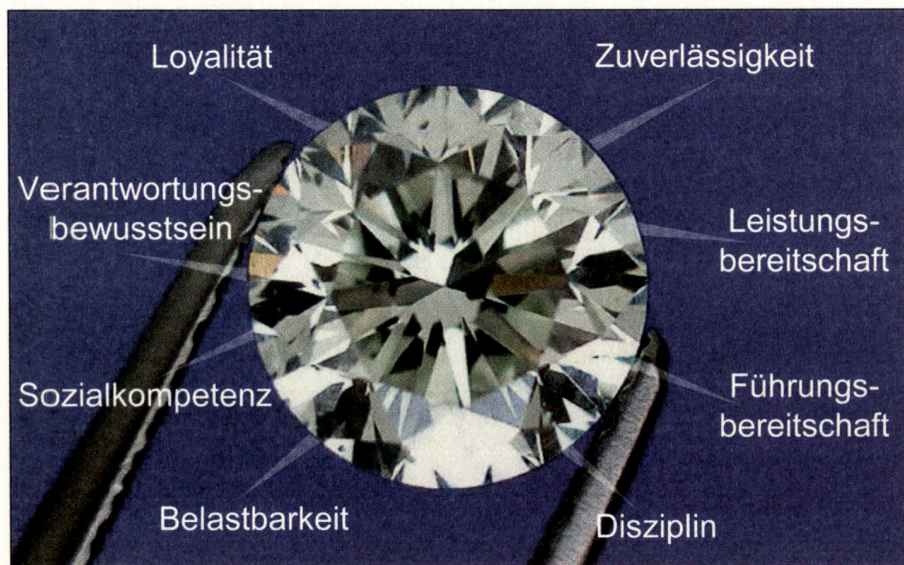
Für Führungskräfte der Armee und der Privatwirtschaft gelten die gleichen Erfolgswerte. Grafiken: Gsponer Consulting Group AG

oder der ideale Projektleiter/in sein! Sie haben solche Situationen ja bereits mehrmals erlebt und eingeübt! Es liegt alleine an Ihrem Verhalten und Ihrer Kommunikation, ob wir ihre Talente und Fähigkeiten, die sie in der militärischen Ausbildung