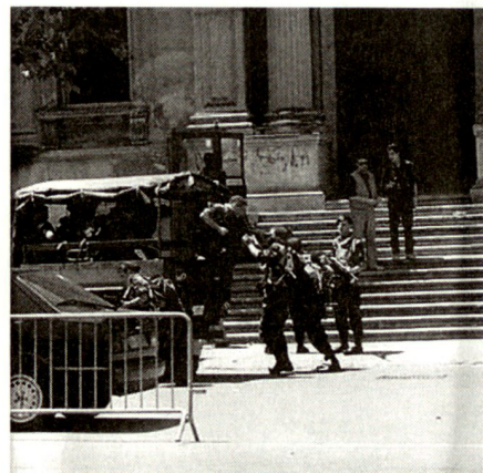
Vigilanza punti sensibili (Op Vespri Siciliani).

In presenza di eccezionali situazioni, in cui sia impossibile utilizzare le strutture militari o quelle eventualmente messe a disposizione dagli Enti Locali/Forze di Polizia, è possibile ricorrere a gestori pri-