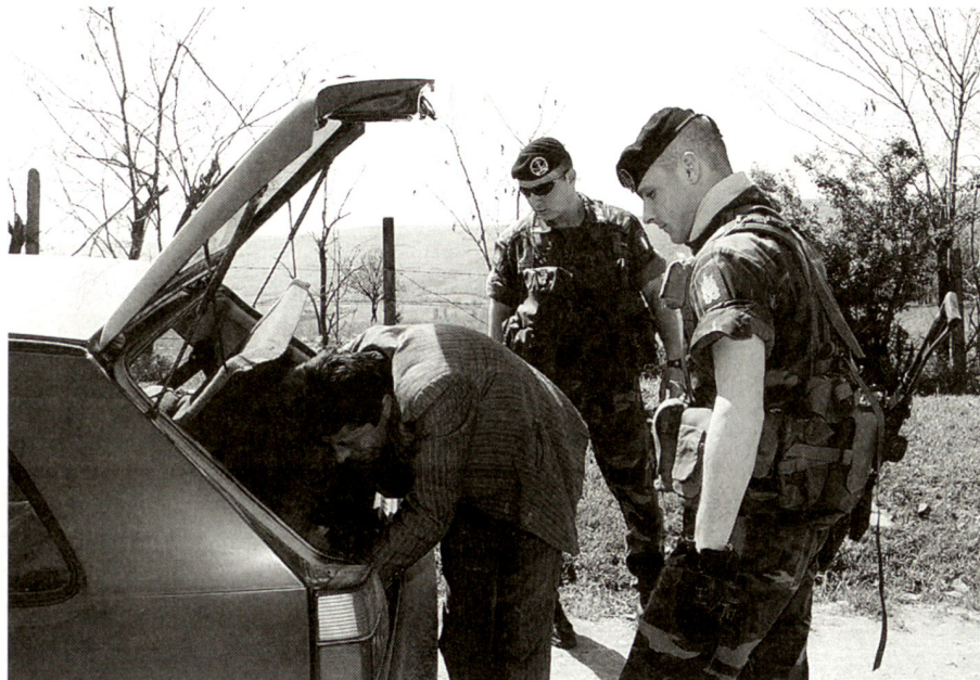
Posto di blocco.

compito, evitino di suscitare il risentimento della popolazione e pregiudicare il consenso dell'opinione pubblica, indispensabile per il successo dell'operazione.