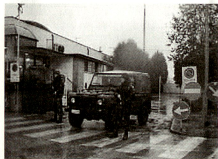
Vigilanza punti sensibili (Op Domino).

Il personale deve essere anche sensibilizzato sulla necessità di mantenere comportamenti che, pur contraddistinti dalla determinazione necessaria all'assolvimento del