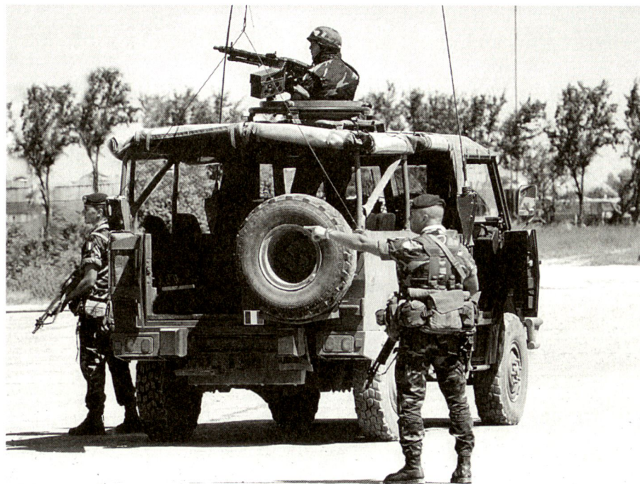
Attività di pattugliamento.

vati previa stipulazione di apposite convenzioni per le esigenze di vettovagliamento e di alloggiamento.