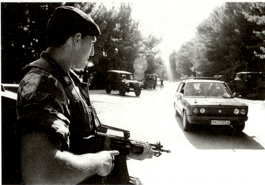
Controllo di rotabile.

L'organizzazione militare apporta un elemento di versatilità importante al dispositivo posto in atto in quanto, non essendo soggetta alla compartimentazione della ripartizione amministrativa, può agire senza dover rispettare i limiti provinciali ed offre un ventaglio di possibilità d'intervento, assicurato dall'entità degli uomini impegnati, dalla polivalenza dei reparti (varietà dei mezzi ed equipaggiamenti a disposizione) e dall'autonomia logistico-funzionale.