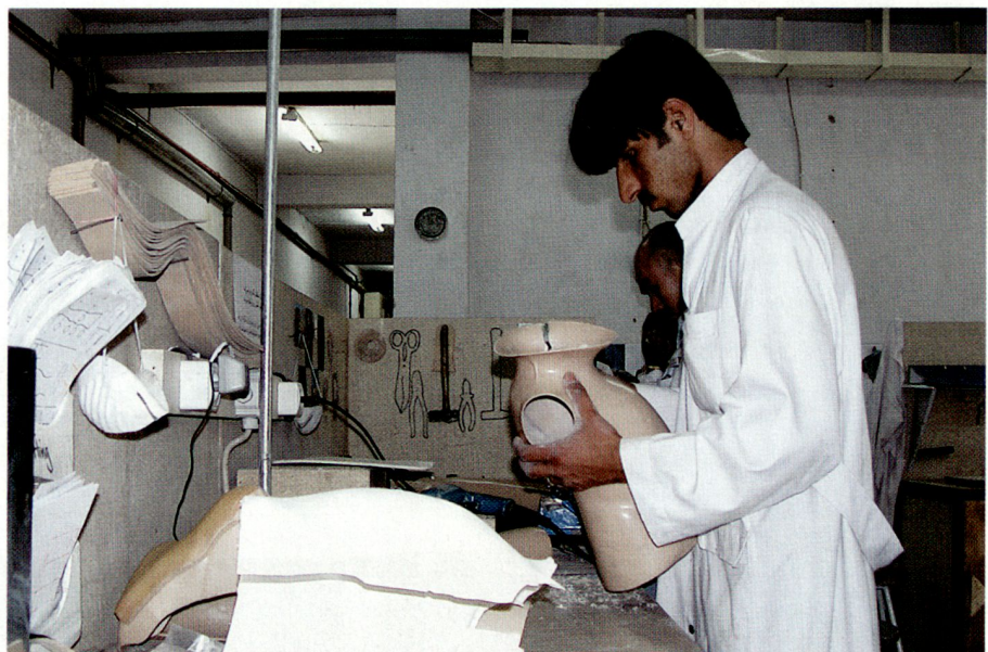
Ein Thorax-Korsett für ein Kind entsteht.

Nicht nur für die unmittelbare Behandlung ist gesorgt. Es werden auch grösste Anstrengungen unternommen, diese Menschen so rasch wie möglich als gleichwertige Mitglieder wieder in die Gesellschaft und den Arbeitsprozess einzugliedern. Dies geschieht mittels Arbeitsvermittlung, Schulausbildung für Kinder und Vergabe von Kleinkrediten an zukünftige Kleinunternehmer. Mehr als 7000 ehemalige Patienten haben diese Chance zur Unabhängigkeit und Selbstständigkeit in Anspruch genommen. Solche vorbildliche Projekte wie die orthopädischen IKRK-Zentren in Afghanistan haben auch für Projekte ausserhalb des Gesundheitswesens Modellcharakter und finden weit über die Landesgrenzen