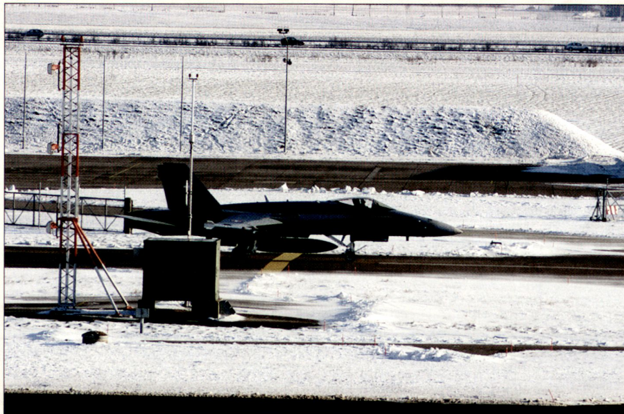
La base aérienne est la clé de voûte des opérations.

Par ailleurs selon les principes mêmes du concept, la BA doit pouvoir fonctionner et fournir les prestations exigées en toute situation. Donc la planification et la conduite des opérations devraient être semblables sinon identiques en toute circonstance, avec ou sans renforcement par la milice.