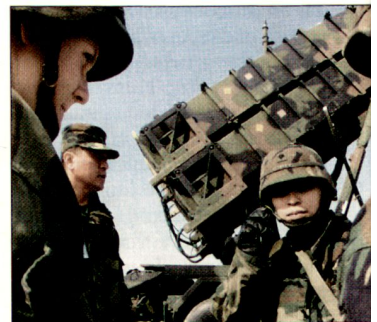
Flab-Lenk Waffensystem «Patriot» während einer Übung in Südkorea.

Ausschlaggebend für die Anstrengungen zur Verbesserung der Luftverteidigung Japans ist die nordkoreanische Raketenbedrohung. Nachdem Nordkorea 1998 eine Mittelstreckenrakete über Japan hinweg getestet hatte, beschloss Tokio unverzüglich, sich an einem gemeinsamen künftigen