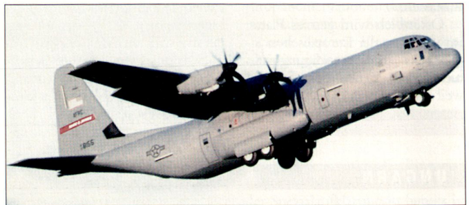
US-Transportflugzeug C-130J «Hercules».

Von der europäischen A400M sind bis heute insgesamt 188 Flugzeuge bestellt worden (siehe auch ASMZ 7/8 2005, Seite 83). hg