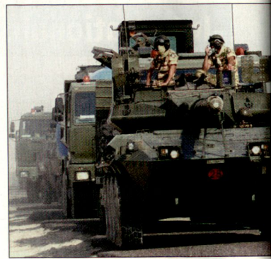
Italienischer Konvoi, geschützt durch Schützenpanzer «Centauro» im Irak.

Insbesondere im Zusammenhang mit der internationalen Terrorismusbekämpfung benötigen die britischen Streitkräfte speziell ausgebildete Truppen. Dadurch erhofft man sich – insbesondere auch nach den Anschlägen in London im Juli dieses Jahres – eine Effizienzsteigerung bei der Bekämpfung