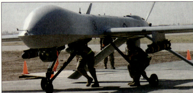
Unbemannter Aufklärungsflugkörper MQ-1 «Predator», ausgerüstet mit zwei Lenk Waffen «Hellfire».

Die aktuellen Planungen sehen nun für die nächsten zehn Jahre eine Erhöhung der Staffelanzahl auf 15 vor; jede Einheit (Staffel) soll über 12 Fluggeräte verfügen. Dabei sollen nebst der Grundversion MQ-1 später auch die leistungstärkere Weiterentwicklung MQ-9, ausgerüstet mit Turbopropo-Antrieb, beschafft werden. UAV-Systeme vom Typ «Predator» stehen bei den US-Streitkräften seit 1995 im Truppeneinsatz. Unterdessen bemühen sich auch andere Staaten (z.B. Italien) um eine Beschaffung solcher unbemannter Luftaufklärungssysteme. Ursprünglich waren die Flugkörper unbewaffnet und wurden mit RQ-1 bezeichnet. hg