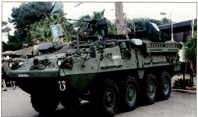
Schützenpanzer «Stryker», ausgerüstet mit dem aktiven Schutzsystem «Trophy».

Bei der Entwicklung von «Trophy» wurden sehr strenge Sicherheitsforderungen der Heeresruppen berücksichtigt. So sollen Hohlladungsgefechtssköpfe, vor allem auch sämtliche von RPGs verschossenen Gefechtssköpfe rechtzeitig ausgeschaltet werden, ohne wesentliche Beeinträchtigung der eigenen Fahrzeuge. Es soll nur sehr vereinzelt zu geringen Kollateralschäden gekommen sein. Einsatz-tests und Simulationen haben zudem ergeben, dass die Gefährdung von sich in der Nähe befindender eigener Infanterie oder Fahrzeugbesatzungen durch Kollateralschäden praktisch nicht vorhanden ist. Das aktive Schutzsystem «Trophy» wird u. a. auch als Zusatzschutz für die amerikanischen Schützenpanzer «Stryker» angeboten. D.E.