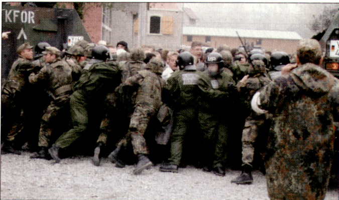
Ausbildung im Verhalten gegenüber Demonstranten an der Infanterieschule der Bundeswehr.

Verlangt wird vom Generalinspekteur deshalb ein tief greifender Prozess des Umdenkens innerhalb und ausserhalb der Bundeswehr. Neben den geplanten Anpassungen von Struktur und Organisation müsse auch der «mentalen Transformation» besondere Beachtung geschenkt werden. hg