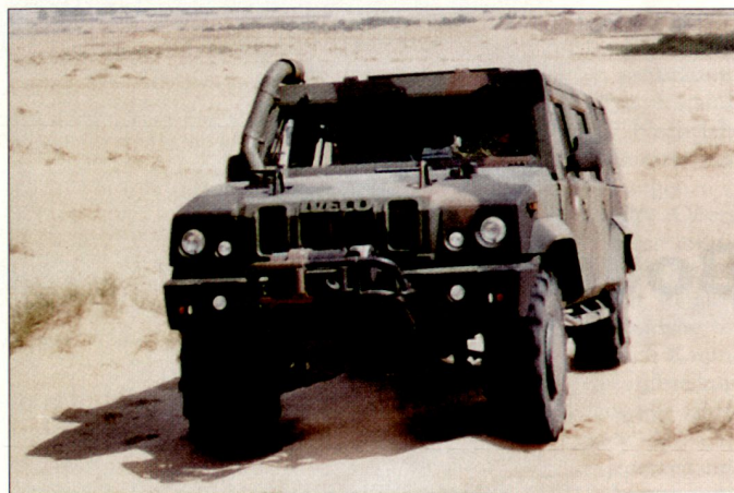
Mehrzweckfahrzeug «Caracal» mit verbessertem Schutz.

schzeitlich diverse so genannte geschützte Fahrzeuge unterschiedlicher Typen (z.B. «Dingo 2», «Duro 3», «Mungo» usw.) aus Mitteln des Sofortbedarfs beschafft worden. Gleichwohl verfügt die Bundeswehr gemäss Aussagen des Einsatzführungsstabes über ein qualitatives und quantitatives Defizit an leistungsfähigen, geländegängigen Fahrzeugen unter-