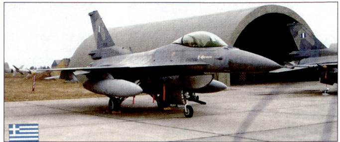
Die griechischen Streitkräfte verfügen bereits heute über Kampfflugzeuge F-16.

weitere 30 Flugzeuge vom Typ F-16 der neusten Generation, die von den USA zu vorteilhaften Bedingungen angeboten werden, gekauft werden. Die bis März 2004 in Griechenland regierenden Sozialisten hatten seinerzeit den Kauf von 30 europäischen Kampfflugzeugen Eurofighter «Typhoon» vorgesehen. Gemäss Aussagen der neuen Regierung wurden diese Pläne sisiert, weil die Beschaffung amerikanischer F-16 wesentlich günstiger zu stehen komme. Nebst neuen Kampfflugzeugen wollen die griechischen Streitkräfte auch 333 Kampfpanzer «Leopard 2» aus