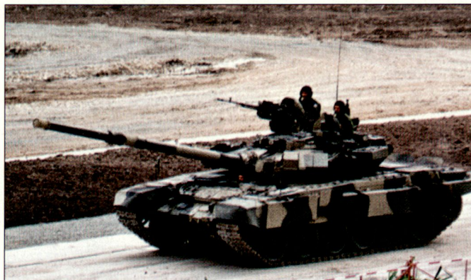
Neue Kampfpfanzern T-90S werden auch in die russische Armee eingeführt.