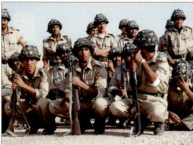
Mit NATO-Unterstützung soll die Ausbildung irakischer Sicherheitskräfte vorangetrieben werden.

von der NATO betriebene Ausbildungszentrum für irakische Offiziere eröffnet. In Anwesenheit des NATO-Generalsekretärs wurde an dem Gebäude in der durch Truppen gesicherten Grünen