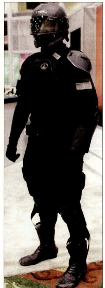
Uniform der Zukunft, vorgestellt durch das Entwicklungslaboratorium der US Army in Natick, Mass. ■

Während gemäss Aussagen der militärischen Planungsstellen die meisten dieser neuen Technologien erst im Zeitraum von fünf bis fünfzehn Jahren verwirklicht werden können, sollen Prototypen der neuen Feldintensivstation bereits in Afghanistan und bei den US-Truppen im Irak im Einsatz stehen. hg