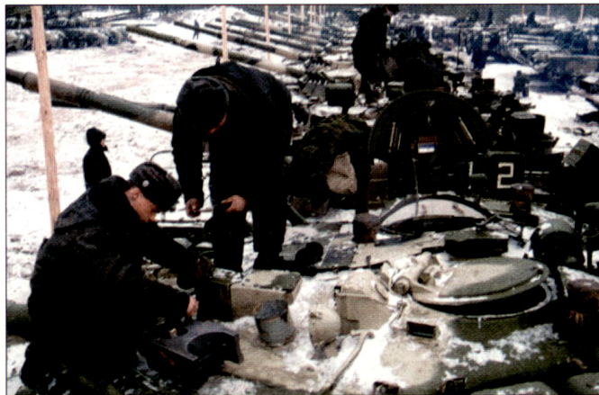
Weiterhin zu hohe Kampfpfanzerbefstände in den russischen Streitkräften.

Ein grosser Teil des restlichen Kampfpfanzerpotenzials, bestehend aus veralteten Typen T-55, T-62 und T-64, ist grösstenteils in Depots eingelagert und dürfte nur noch beschränkt einsatzfähig sein. Die im Truppendienst stehenden Typen T-80 und T-90 sowie die Zahl der bisher modernisierten T-72 soll heute rund einen Drittel (ca. 8500) des gesamten Panzerparks ausmachen. Bisher können in Russland, vermutlich aus finanziellen Gründen, jährlich lediglich 250 bis 300 veraltete Kampfflugzeuge der Vernichtung zugeführt werden. Zudem besteht heute nur noch ein beschränkter Markt für veraltete Kampffahrzeuge.