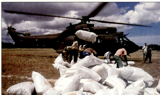
Spanischer Militärhelikopter «Super Puma» bei Hilfeinsätzen in Afrika.

Die spanische Militärführung hat diesen Herbst bekräftigt, dass im nächsten Jahr nebst dem weiter laufenden Truppeneinsatz auf dem Balkan vor allem die internationale Stabilisierungstruppe für Afghanistan (ISAF) unterstützt werden soll. Spanien wird dabei zusammen mit italienischen Truppen mehr Führungsverantwortung für die PRTs in den westlichen Provinzen Afghanistans übernehmen. Das spanische Kontingent bei der ISAF beträgt gegenwärtig rund 1400 Soldaten; bei Bedarf soll im nächsten Jahr dieser Bestand allenfalls erhöht werden. Zudem wird mit einem vermehrten Einsatz der Streitkräfte für humanitäre Hilfeleistungen in Afrika gerechnet. hg