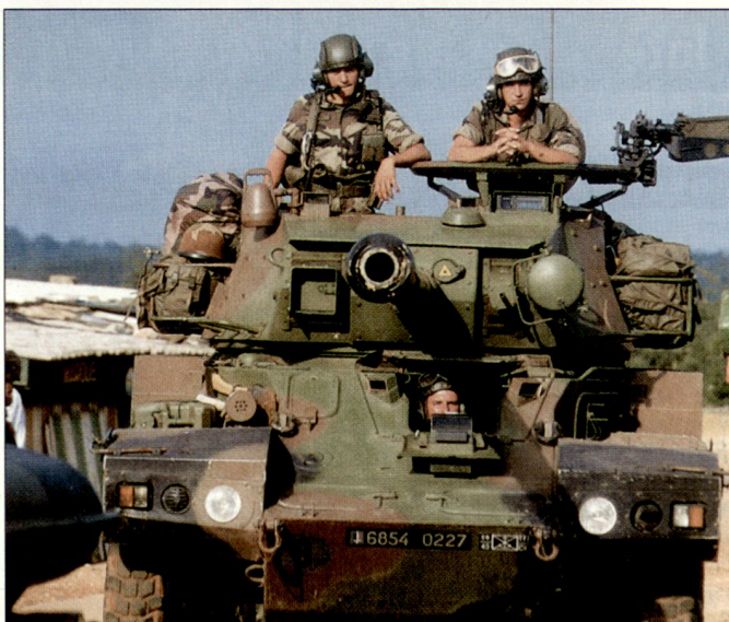
Kampffahrzeug «Sagaie» im Einsatz bei den französischen Truppen in der Elfenbeinküste.

Diverse Hinweise deuten bereits heute darauf hin, dass Frankreich auf Grund der Lageentwicklung die seit Jahren laufenden Militäreinsätze in der Elfenbeinküste und im Tschad aufheben will. Die heute dort dislozierten militärischen Kräfte sollen zu einem Teil in die anderen drei afrikanischen Stützpunktstaaten (Senegal, Dschibuti und Gabun) verschoben werden. Gleichzeitig will Frankreich noch verstärkt mit den vorhandenen afrikanischen Regionalorganisationen zusammenarbeiten. Die französische Regierung lässt zudem durchblicken, dass die militärstrategischen Interessen auf dem