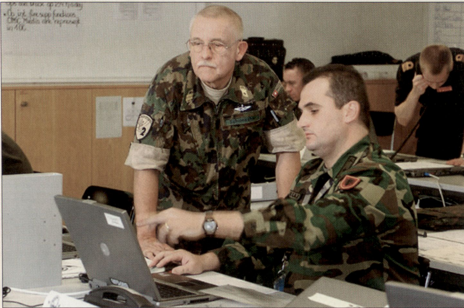
Teile des multinationalen Stabes an der Arbeit im Tactical Operations Centre TOC.

einsatzfähig sind. Zusätzlich hat die Milizerfahrung der Offiziere in der «Log Branch» viel zum Ergebnis beigetragen (z.B. Verhandlungen mit zivilen Behörden, usw.).»