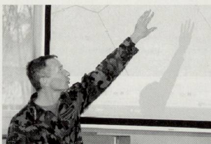
Kommunikation – unerlässliche Tätigkeit von Kommandant und Stabsangehörigen. (links Kdt Geb Inf Br 10)

Im Bereich des Aktionsplanungsprozesses muss hervorgehoben werden, dass in erster Linie Grundlageninformationen erforderlich sind, aufgrund derer die Entscheidungskriterien für die Entschlussfassung entwickelt werden können. Diese Grundinformationen müssen jedoch in regelmässigen Abständen der Ist-Situation angepasst werden, damit auch Folgeplanungen auf der korrekten Ausgangslage basieren. Die à-jour-Haltung der Grund-