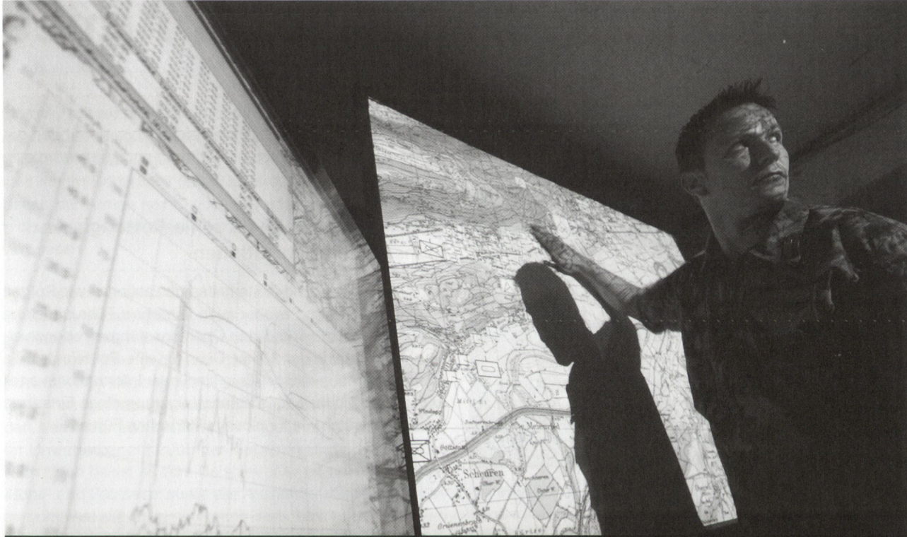
Gemeinsames Lagebild statt „Packpapier-Führung“: Die vernetzte Operationsführung wird die Führungsprozesse in nie gekanntem Ausmass modernisieren und deren Ergebnisse verbessern.

und erfüllt werden. So kann auf einem Gefechtsfeld jeder befugte, und entsprechend ausgerüstete Kommandant ohne Kenntnisse über die Einsatzführung und -methode der Luftwaffe per Knopfdruck zeitgerechte und zielgenaue Luftunterstützung anfordern und auslösen. Die Technologie ersetzt aber auch bei der vernetzten Operationsführung den Menschen nicht. Dieser steht weiterhin im Zentrum der Operationsführung. Die Verantwortung des Führers kann weder durch Automatisierung noch durch Vernetzung reduziert werden. Ihm stehen allerdings Mittel zur Verfügung, mit denen sich die Qualität seiner Entscheidungen deutlich verbessern lässt und die ihm deutlich höhere Erfolgschancen einräumen.