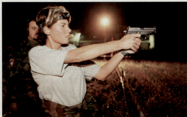
Impressionen während des Wettkampfes.