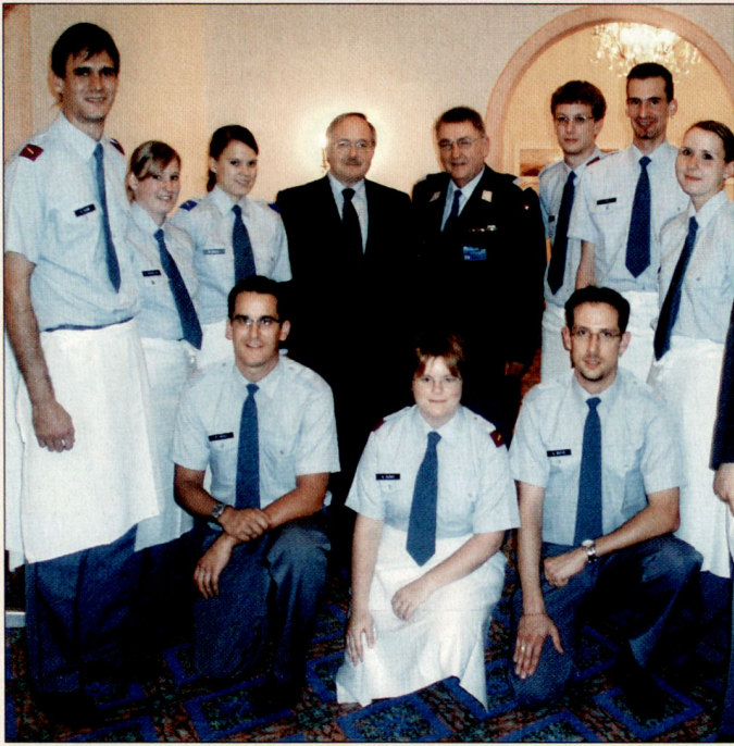
VIP-Anlass Bundesrat Schmid unterstützt durch Dienstpersonal.

der Kaserne Chur eingerichtet, wo auch das Gros der Truppe einquartiert war. Eine Unterbringung in der Region Flims/Laax war aufgrund der beschränkt vorhandenen Infrastruktur sowie des Platzbedarfes für die Angehörigen der Armee und Fahrzeuge nicht möglich. Davon ausgenommen war die Hauptquartier Telematikkompanie 25/3, welche ihren Dienst in Bonaduz leistete. Dies ermöglichte ihnen u. a. die optimale Sicherstellung eines militärischen Funknetzes während des Einsatzes. Zudem befand sich ein Detachement in Bern im Dienst, welches für die Sicherstellung einer Videoverbindung zwischen dem Führungsraum der Bundeskanzlei in Bern und Flims zuständig war.