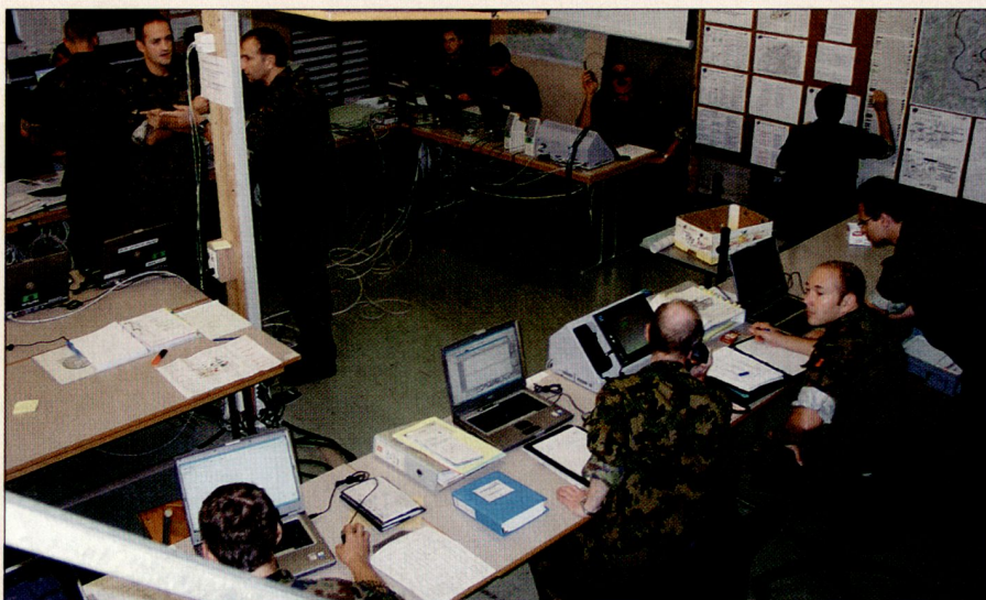
Das TOC (Tactical Operations Center) einer Brigade im Einsatz während der Übung SIEGFRIED (Raumsicherung).

Wesentliche Fortschritte wurden in der Umsetzung der Stabsprozesse sowie in der Stabsorganisation erzielt. Die Abläufe gemäss Reglement Führungs- und Stabsorganisation (FSO XXI) und Behelf für Generalstabsoffiziere (BGO) wurden in den Stäben etabliert. Auch die Zusammenarbeit mit den zivilen Partnern wurde laufend verbessert.