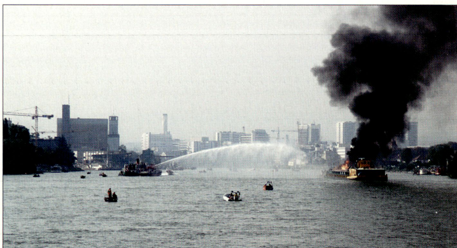
Feuerlöschboot «Christopherus» stellt sich schützend vor das Passagierschiff.