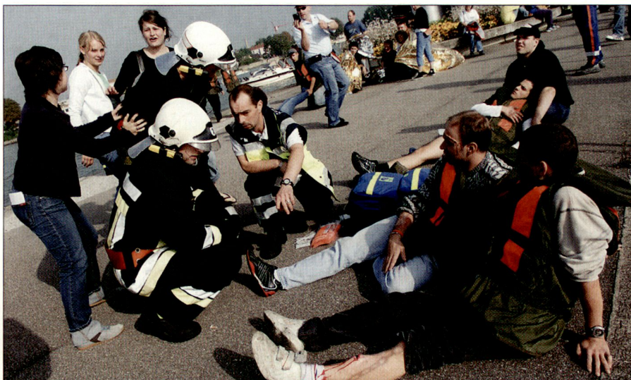
Betreuung von verletzten Passagieren auf französischer Seite.