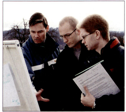
Praktische Arbeit im Gelände.

Die Arbeit war vorwiegend praktisch. Die gefechtstechnischen Entschlüsse wurden im Gelände ausserhalb und im Zentrum von Winterthur erarbeitet. Sie wurden mit drei Exposés bereichert: «Der Polizeikompass –