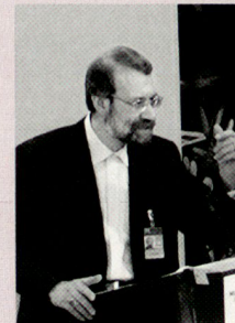
Dr. Ali Laridschani, Chefunterhändler für das iranische Atomprogramm.