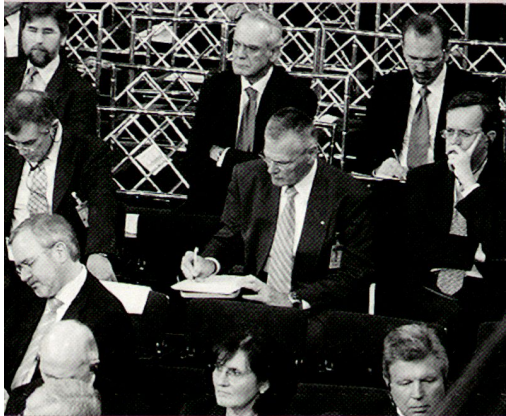
KKdt Christophe Keckeis, Chef der Schweizer Armee.