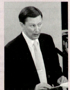
Der russische Verteidigungsminister und ehemalige KGB-Mitstreiter von Präsident Putin, Sergej Iwanow. Dieser gilt auch als Kronfavorit bei der Nachfolge von Putin.