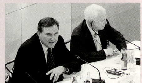
Der deutsche Verteidigungsminister Dr. Franz Josef Jung (links) und der US-Senator John S. McCain, ein Anwärter auf die republikanische Präsidentschaft 2008.

Blick in den Saal des Hotels Bayerischer Hof, dem jährlichen Veranstaltungsort der Konferenz für Sicherheitspolitik. Im Parterre nehmen jeweils die zu Voten berechtigten Teilnehmer Platz, während die Emporen den Beobachtern gehören.