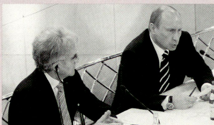
Der verdienstvolle Organisator und Gastgeber Prof. Dr. h.c. Horst Teltchik (links), ehemals Berater von Kanzler Kohl, und der russische Präsident Wladimir Putin, ehemals Angehöriger des KGB.