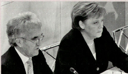
Prof. Dr. h.c. Horst Teltchik und Bundeskanzlerin Angela Merkel.