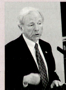
Der frühere demokratische US-Senator Joe Liebermann (Connecticut), der 2006 als Unabhängiger wieder in den Senat gewählt wurde. Er und McCain sind regelmäßige Teilnehmer in München.