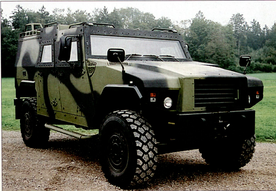
EAGLE-IV-Patrouillienfahrzeug in den Tarnfarben der Königlichen Dänischen Armee.