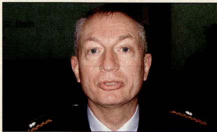
Brigadier Charles Pfister.

Brigadier Pfister legte zuerst die Kräfteverhältnisse dar, wie sie bei Ausbruch des zweiten Libanonkrieges bestanden. Die schwache libanesischen Armee umfasste