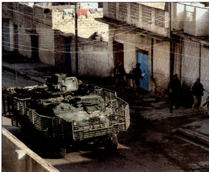
Die US Army soll um 65 000 Soldaten aufgestockt werden.

Bis nun aber die beschlossene Aufstockung der aktiven Truppen Form annimmt, bleibt das Penta-