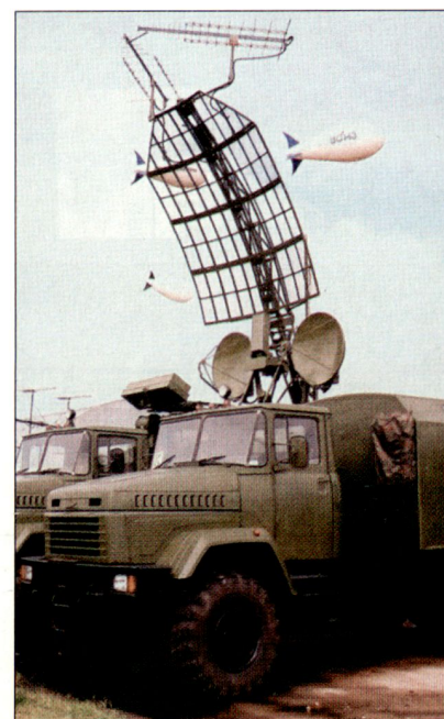
Mobiles Radarsystem «Kolchuga» an einer Rüstungsausstellung.

Beim mobilen Radarsystem «Kolchuga» handelt es sich um ein passiv arbeitendes Funkmess-Überwachungssystem, das im Rahmen der bodengestützten Luftverteidigung eingesetzt werden kann. Das leistungsfähige System kann alle Emissionen von Flugzeugen (Funk, Radar, Navigationssignale usw.) erfassen, analysieren und identifizieren. Dabei werden keine eigenen elektromagnetischen Wellen ausgestrahlt, wodurch eine Aufklärung der Station erschwert wird. Das «Kolchuga»-System besteht aus einem Antennenkomplex mit vier Antennen, die in unterschiedlichen Frequenzbereichen arbeiten. Diese