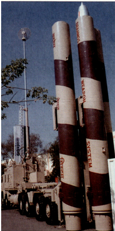
Landgestützte Version des Marschflugkörpers «BrahMos». (Prototyp bei den indischen Streitkräften)

Gemäss russischen Quellen wollen die indischen Streitkräfte in den nächsten Jahren insgesamt 1000 Marschflugkörper vom Typ