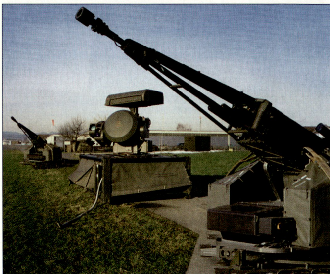
Der Nächstbereichsschutz soll auf Basis des Flab-Systems «Skyshield» realisiert werden.

zeichneten Projektierungsvertrags umfasst 48 Mio. Euro. Der Vertrag zielt auf die Entwicklung der Fähigkeit, sogenannte RAM-Ziele (Raketen, Artilleriegeschosse und Mörser) mit leistungsfähigen Mitteln der Fliegerabwehr effektiv bekämpfen zu können. Nach Abschluss der Entwicklungsarbeiten soll die erste funktionelle NBS-Einheit gegen Ende 2009 zur Verfügung stehen. Ab diesem Zeitpunkt können Camps der Bundeswehr, beispielsweise in Afghanistan, bei einem entsprechenden Beschaffungsauftrag mit diesen Nächstbereichs-Schutzsystemen ausgestattet werden.