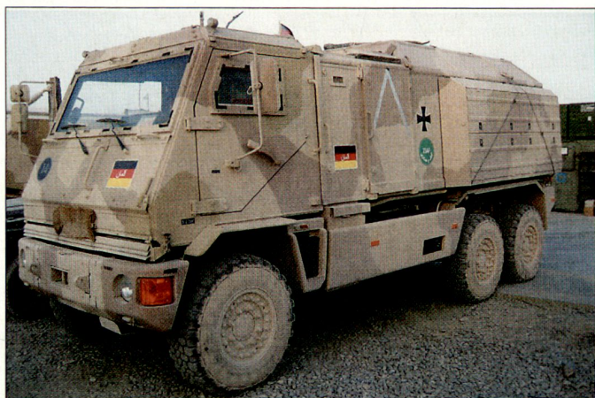
Der in Kooperation zwischen Mowag und Rheinmetall hergestellte «Yak» resp. «Duro 3» erfüllt die gestiegenen Anforderungen des Heeres an geschützte Transportfahrzeuge.

einen wesentlichen Beitrag zum optimierten Schutz der Soldaten im Einsatz und gleichzeitig auch zur Vereinheitlichung der Fahrzeugflotten. Der «Yak» (Duro 3) gewährleistet seinen Besatzungsmitgliedern ballistischen Schutz sowie Schutz gegen seitliche Ansprengungen durch IEDs und verfügt auch über einen integrierten Minenschutz. Bei der deutschen Bundeswehr befindet sich der «Yak» in den Varianten BAT (beweglicher Arzttrupp), Bodenkontrollstation «LUNA» (für Drohnensystem), EOD (Kampfmittelbeseitigung) und Feldjäger im Einsatz. Mit dem erhöhten Bedarf und den gestiegenen Anforderungen des Heeres an geschützten Transportraum dürften in den nächsten Jahren weitere Beschaffungen folgen. Auch andere Armeen sind in verstärkter Masse an diesem Fahrzeug interessiert. hg