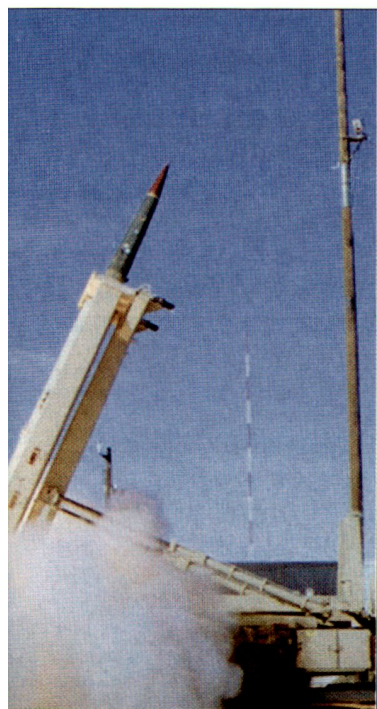
Test mit dem Luftverteidigungssystem THAAD.

gon weiterhin auf den regelmässigen Einsatz der Reserve angewiesen (siehe auch ASMZ 3/2007, Seite 40). Früher durfte ein Army-Reservist für einen gegebenen Konflikt maximal 24 Monate aktiviert werden. Diese Beschränkung wurde nun aufgehoben. Denn ein hoher Anteil der Kampf- und Unterstützungsverbände der Army-Reserve und Nationalgarde haben bereits 18- bis 20-monatige Einsätze im Irak oder teilweise auch in Afghanistan hinter sich. Gezwungenermassen müssen jedoch einige dieser Einheiten demnächst wieder in den Mittleren Osten entsandt werden, um die im Irak geforderte Kräftepräsenz aufrechtzuerhalten. hg ■