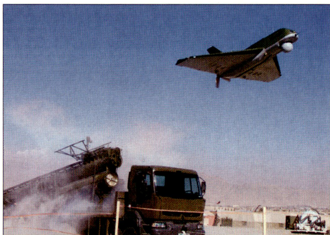
Start einer Aufklärungsdrohne «Sperwer» im Süden Afghanistans.

Das Überwachungssystem «Kolchuga» wird seit Ende der 90er-Jahre durch die ukrainische Rüstungsindustrie an internationalen Rüstungsausstellungen regelmässig präsentiert. Gemäss Militärexperten wurden bis heute etwa 80 dieser Systeme durch die Herstellerfirma Topaz produziert und ein wesentlicher Teil davon auch exportiert. hg