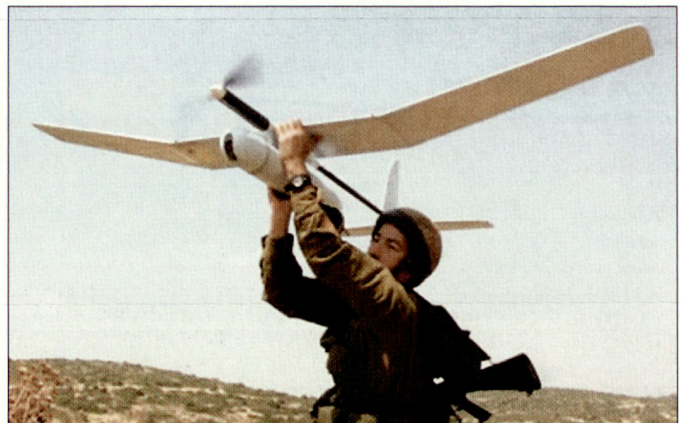
Das Drohnensystem «Skylark» steht bei der israelischen Armee sowie bei Streitkräften mehrerer NATO-Staaten im Einsatz.

Gemäss vorliegenden Informationen hat die australische Armee im Jahre 2005 bei Elbit sechs Systeme «Skylark I» gekauft und diese bereits kurz darauf ihren Truppen im Süden des Irak zur Verfügung gestellt. Im Weiteren sollen auch die kanadischen sowie die niederländischen Truppen bei der ISAF (International Security Assistance Force) in Afghanistan über «Skylark»-Drohnen verfügen. Das niederländische Kontingent soll diese Aufklärungsmittel zusammen mit den zehn «Aladin»-Mini-UAVs für dringende Missionen einsetzen.