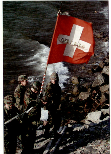
Ein herausragendes Beispiel: Das Gebirgsschützenbataillon 8 weiss mit seiner attraktiven Fahnenübernahme seine Gäste zu begeistern.