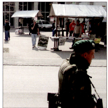
Der einsame Soldat auf Patrouille.

Heute ist das anders. Nicht mehr das Gefechtsfeld mit vorbereiteten Stellungen,