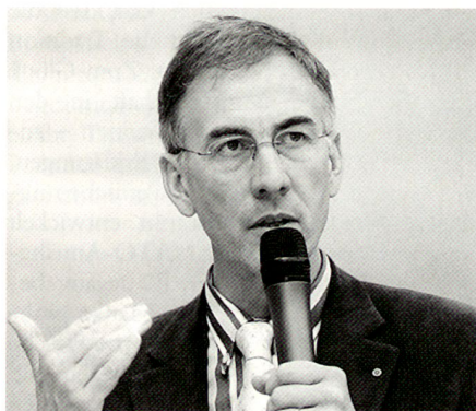
Oberst Pius Segmüller.

Heiko Borchert schnitt die brisante Frage an, ob die Schweizer Armee im Dienst der Landesinteressen mehr bewirken könnte. Schliesslich bedrohen uns nicht nur klassische Gewaltrisiken, sondern ist beispielsweise an die gefährdete Energieversorgung oder die Währungsstabilität zu denken, zumal wir mit zentralasiatischen Ländern auf