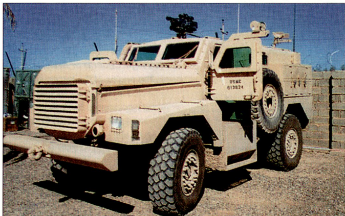
Die US-Streitkräfte im Irak sollen möglichst rasch mit geschützten Transportfahrzeugen «Cougar» ausgerüstet werden.

des Budgets dieser Dienststelle ist offensive Massnahmen, d. h. dem Kampf gegen Untergrundnetzwerke, Bombenlabors und Unterbindung des Waffentransfers gewidmet. Im Vordergrund stehen aber die defensiven Massnahmen zur Verbesserung des Fahrzeugschutzes. Um den hohen Bedarf an geschützten Fahrzeugen für die US-Streitkräfte rasch zu decken (betrifft vor allem die US Army und das Marine Corps), wurde die Firma «Force Dynamics» gegründet; dabei handelt es sich um ein 50:50-Joint Venture der Firmen «Force Protection» und «General Dynamics Land Systems». Im Vordergrund steht die Produktion von geschützten Mehrzwecktransportfahrzeugen vom Typ «Cougar».