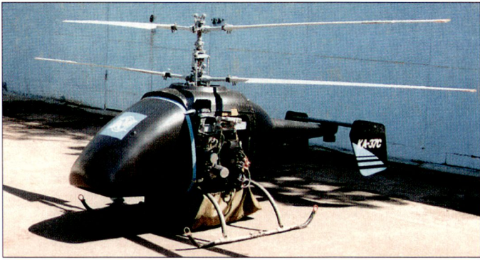
Unbemannter Kleinhelikopter Ka-37 von Kamov.

mannte Flugkörper, die für Aufklärungszwecke genutzt worden sind, entwickelte. Bekannt geworden sind die bereits bei den damaligen sowjetischen Streitkräften im Einsatz gestandenen Aufklärungsdrohnen der Typen VR-2 «Strizh» und VR-3 «Reis-D», bei denen Flugkörper der Typen Tu-141 und Tu-143 resp. Tu-243 verwendet wurden. Federführend bei den russischen UAV-Entwicklungen ist heute die Firma Yakovlev. Nebst der vor allem während der Tschetschenienkriege zum Einsatz gelangenen mobilen Drohne «Pchela-1» hat die Firma im Frühjahr 2007 erstmals die Kleindrohne «Pchela-2» präsentiert. Weitere Neuentwicklungen von Yakovlev sind die UAV-Systeme «Expert»