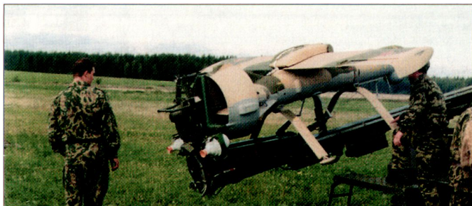
Im Tschetschenienkrieg wurden bisher vor allem Aufklärungsdrohnen vom Typ «Pchela-1» eingesetzt.

und «Albatros», die sich gemäss Herstellerangaben vor allem auch für Aufklärungsmissionen im urbanen Umfeld eignen sollen. Weitere russische Firmen, die sich mit der Entwicklung von Aufklärungflugkörpern beschäftigen, sind Kazan, Radar-MMS, Kamov und Istra-Aero. Wie in den westlichen Staaten liegen dabei auch in Russland die Entwicklungsschwerpunkte bei den Kleindrohnen sowie vermehrt auch bei ferngesteuerten Kleinhelikoptern, die mit unterschiedlichen Aufklärungs- und Beobachtungssensoren sowie auch funktechnischen Mitteln ausgerüstet werden können. Beispiele solcher rotorgetriebenen UAV sind die Typen Ka-37, Ka-137 sowie das Projekt Ka-226. hg