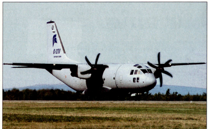
Transportflugzeuge aus Europa für die US-Streitkräfte (Bild: C-27J «Spartan»).

Transportflugzeuge vom Typ C-27J «Spartan» wurden bisher von Italien (12), Griechenland (12), Bulgarien (5), Rumänien (7) und Litauen (3) bestellt. Für den Konkurrenten CASA C-295 haben sich bisher Spanien (9), Polen (8), Portugal (12), Algerien (10), Finnland (2) und Brasilien (12) entschieden. Zudem liegen Bestellungen von arabischen Staaten vor. hg