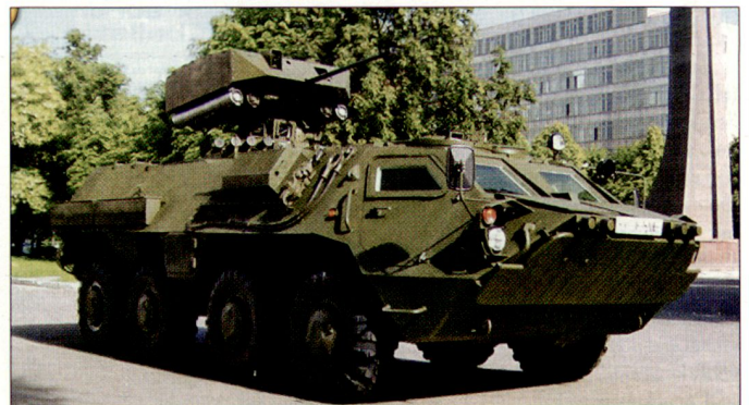
Ukrainischer Schützenpanzer BTR-4 «Grom», bewaffnet mit Kanone 30 mm und Panzerabwehrenkaffen.

Das Gesamtgewicht der Normalversion beträgt rund 17 Tonnen; mit nachgerüsteter Zusatzpanzerung, die einen Fahrzeugschutz gegen Beschuss bis Kaliber 14,5 mm gewährleisten soll, wird allerdings das Gewicht mehr als 20 Tonnen betragen. hg