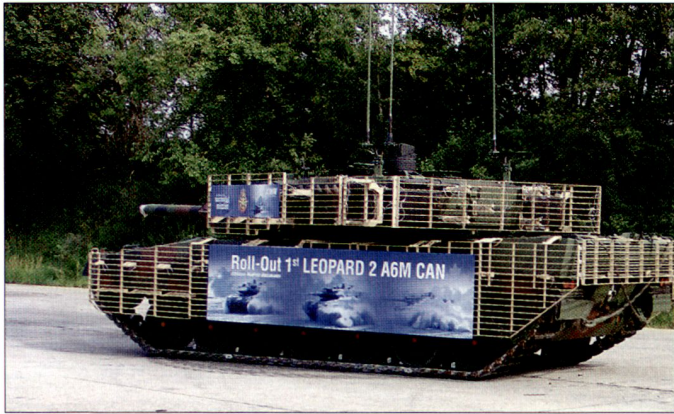
Modifizierte Kampfpanzer «Leopard 2A6M» für die kanadischen Streitkräfte.

mit leistungsfähigere Kanone 120 mm L55. Im Auftrag der kanadischen Armee wurden die 20 Panzer zusätzlich für die Extrembedingungen in Afghanistan nachgerüstet. So wurden die «Leoparden» noch mit moderner Funktechnik, mit zusätzlichen Schutzpaketen und starken Klimaanlage ausgestattet.