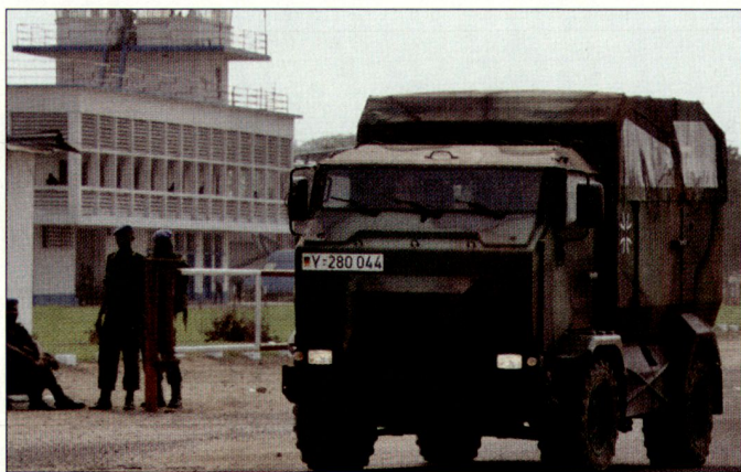
Einsätze in Krisenregionen bergen hohe Risiken und Gefahren; künftig sollen nur noch geschützte oder gepanzerte Fahrzeuge (Bild «Mungo») Verwendung finden.

lung sowie ein Sofortkauf von entsprechenden Störsendern. Gemäss Pressemitteilungen befinden sich in Deutschland drei solcher Stör-systeme in Entwicklung resp. bereits in der Erprobungsphase. Allerdings dürfte es noch einige Zeit dauern, bis deren Beschaffung vorgenommen werden kann. Vor-erst soll aber die bereits beschlossene Einführung geschützter Fahrzeuge fortgesetzt und vor allem deren Einsatzfähigkeit besser gewährleistet werden. Denn wie aus Berichten der Bundeswehr zu lesen ist, sind bei der Ersatzteilversorgung für die neuen geschützten Fahrzeuge Engpässe aufgetreten. So sollen in Afghanistan und im Kosovo nur etwa die Hälfte dieser neuen Fahrzeuge einsatzbereit sein. Als Begründung wird angeführt, dass aufgrund des einsatzbedingten Sofortbedarfes eine beschleunigte Beschaffung vorgenommen werden musste. Dadurch konnte wegen fehlender Haushaltsmittel die Bereitstellung von Wartungsmitteln und Ersatzteilen nicht im vollen Umfang gewährleistet werden. Unterdessen seien aber bei der Ersatzteilversorgung Verbesserungen festzustellen. hg