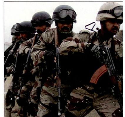
Irakische Soldaten eines mechanisierten Bataillons bei der Ausbildung.

In der Zwischenzeit wird die durch einzelne NATO-Staaten unterstützte Rüstungshilfe an die irakischen Sicherheitskräfte weiter fortgeführt. Die deutsche Bundeswehr wird beispielsweise in diesem Jahr – wie bereits in den letzten Jahren – eine grössere Anzahl von Lastwagen und Sanitätsfahrzeugen gratis abgeben. Aber auch andere NATO-Partner unterstützen die neue irakische Armee sowie die Polizeikräfte mit Bewaffnung und Ausrüstung, die meist über die